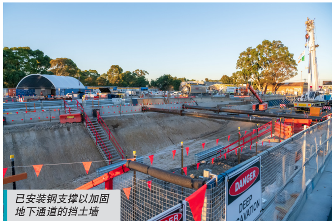
已安装钢支撑以加固地下通道的挡土墙