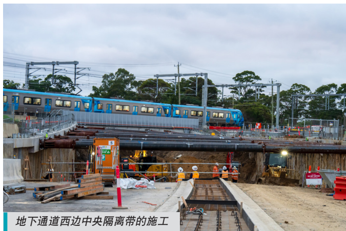
地下通道西边中央隔离带的施工