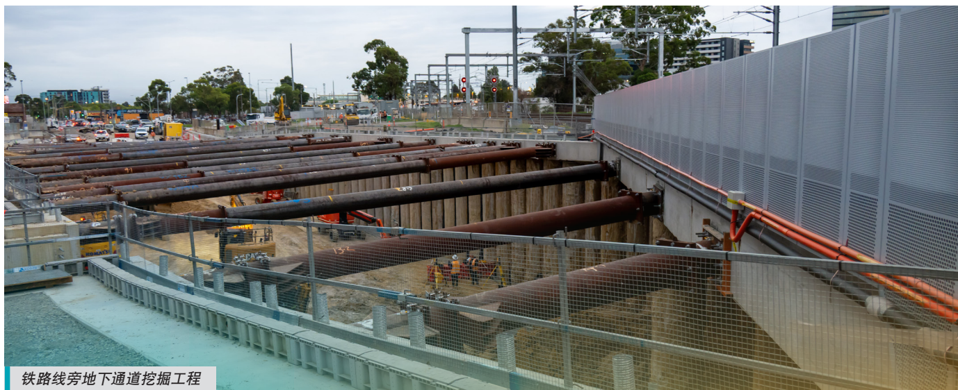
铁路线旁地下通道挖掘工程