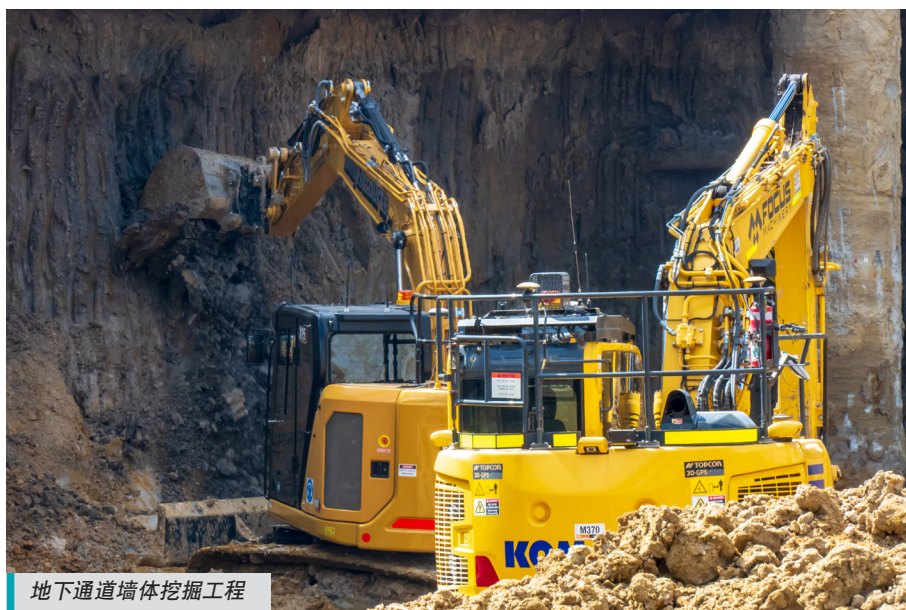
地下通道墙体挖掘工程