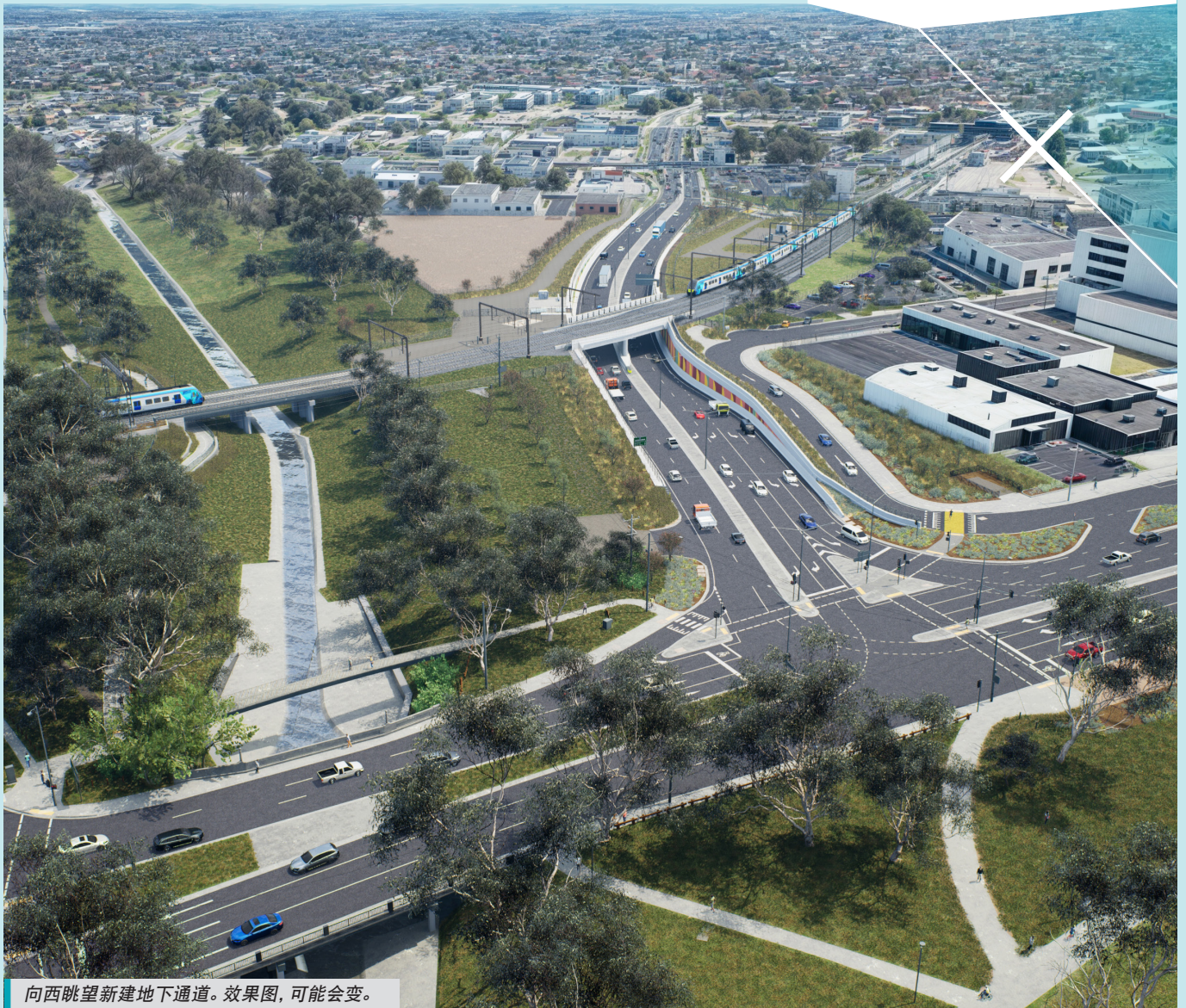
向西眺望新建地下通道。效果图，可能会变。