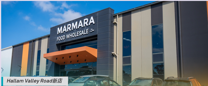
Hallam Valley Road新店

Marmara Halal Meats 地址: 20 Hallam Valley Road, Dandenong 电话: 03 9708 5455 早上7点到晚上7点营业 f marmarahalalmeats @ marmara.halal.meats