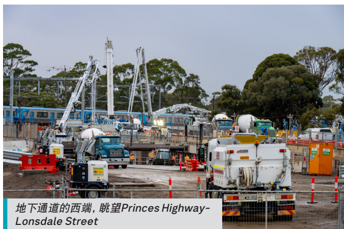
地下通道的西端，眺望Princes Highway-Lonsdale Street