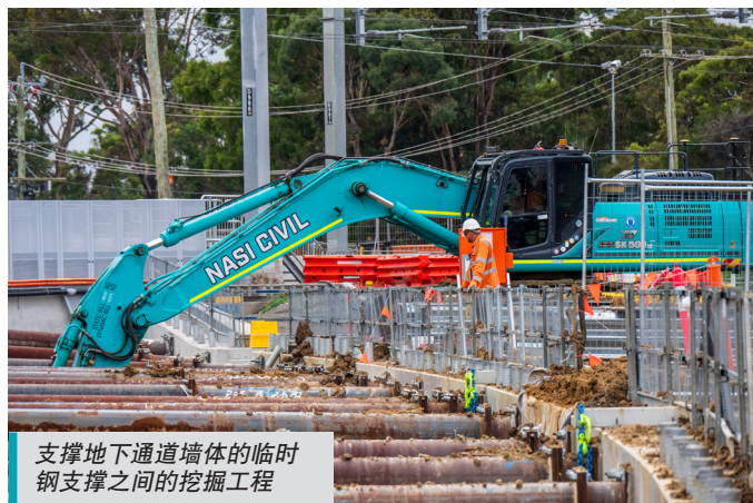
支撑地下通道墙体的临时钢支撑之间的挖掘工程