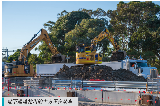
地下通道挖出的土方正在装车