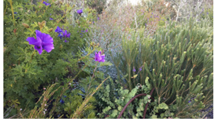
Royal Park'daki Woody Meadow.

Ağaçsı Çayır, Melburn Üniversitesi tarafından yürütülen ortaklaşa bir proje olup, Glenroy'da dahil olmak üzere bazı Hemzemin Kaldırma Projelerinin alanlarında uygulanmaktadır.