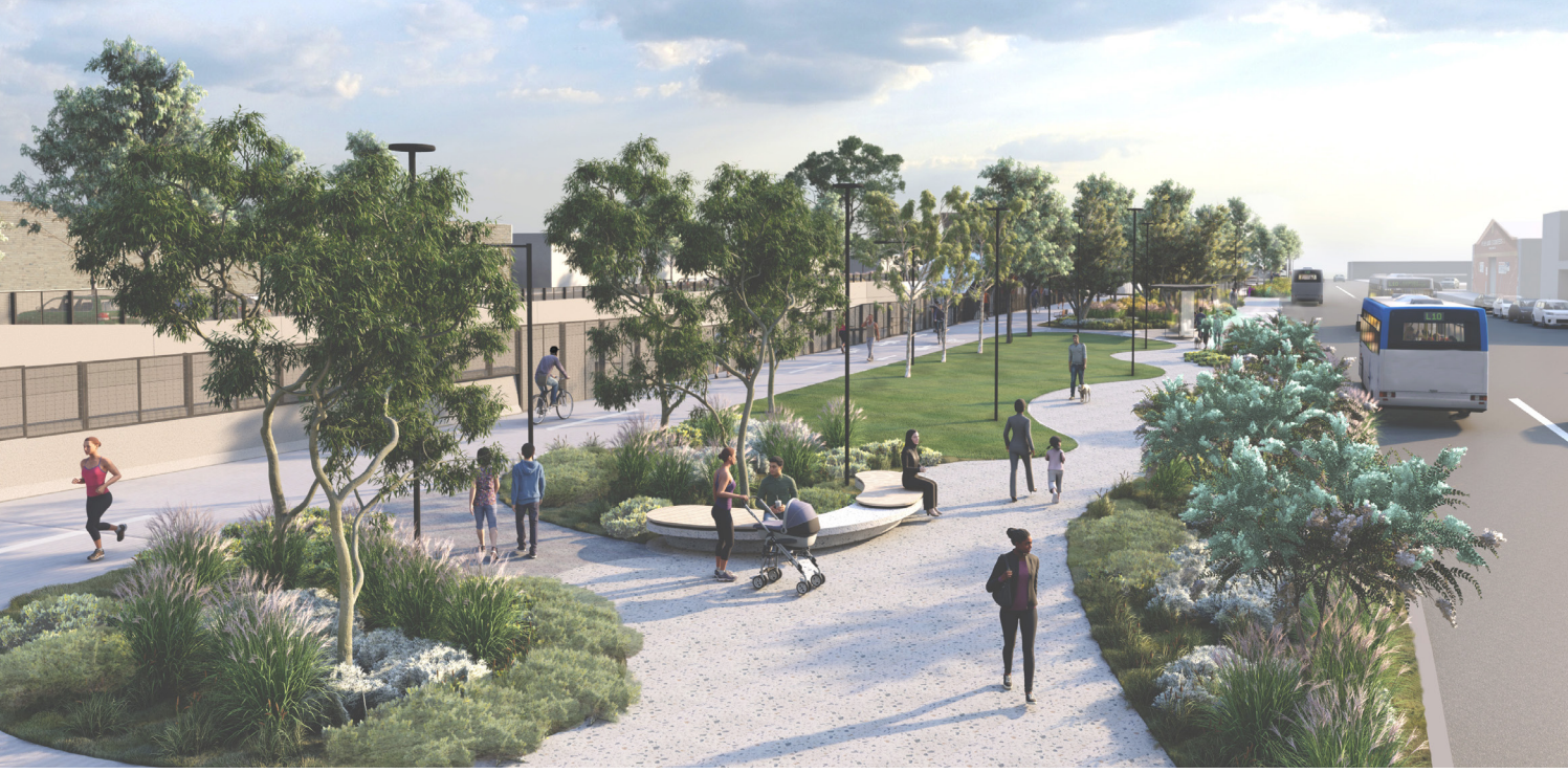
Hartington Street boyunca uzanacak olan yeni refüj park alanı. Mimari maket çizimi.