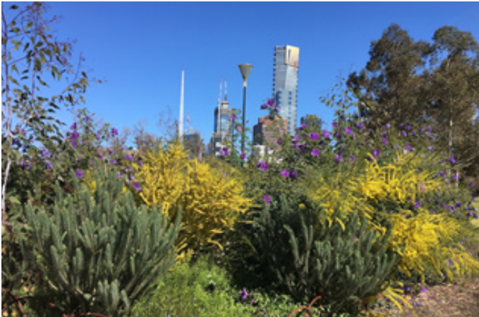
Birrarung Marr'daki Woody Meadow.