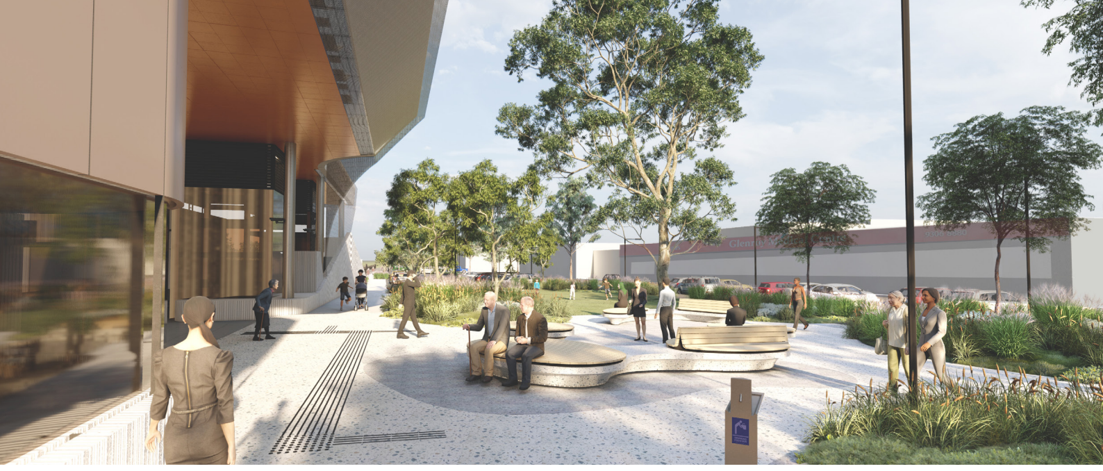
Glenroy İstasyonu, Dowd Place tarafı batı ön avlusu. Mimari maket çizimi.

Yeşillendirmenin büyük bir kısmı, ılıman havanın dikim için elverişli olduğu 2022 yılı Sonbahar ve Kış aylarında gerçekleşecektir.