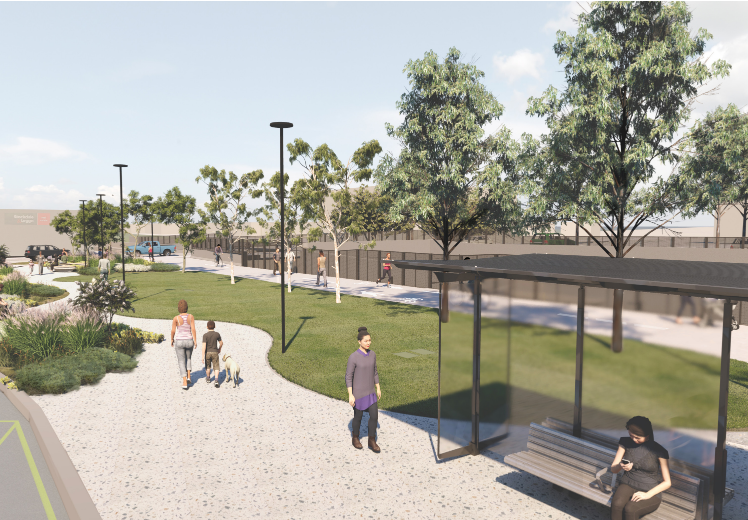
Özel kaldırım alanları ve ışıklandırma tasarımın parçasıdır. Mimari maket çizimi.

Otobüs bekleyen veya istasyona erişmek isteyen yolculara karşılama noktası gibi hizmet verecek olan yeni bir otobüs terminali park alanına (aşağıda) entegre edilecektir.