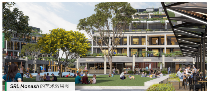
SRL Monash 的艺术效果图