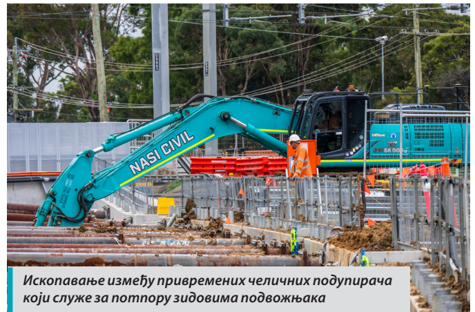
Ископавање између привремених челичних подупирача који служе за потпору зидовима подвожњака