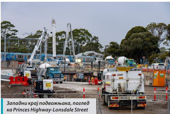
Западни крај подвожњака, поглед ка Princes Highway-Lonsdale Street