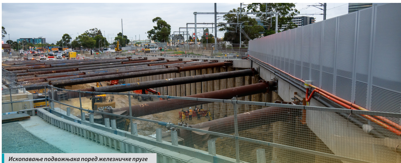
Ископавање подвожњака поред железничке пруге