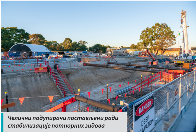
Челични подупирачи постављени ради стабилизације потпорних зидова