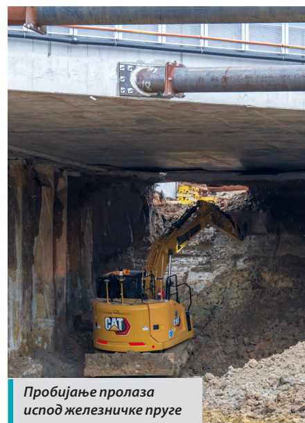
Пробијање пролаза испод железничке пруге