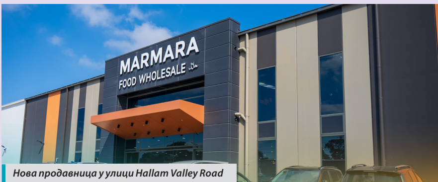
Нова продавница у улици Hallam Valley Road

f marmarahalalmeats @marmara.halal.meats