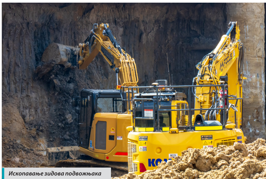
Ископавање зидова подвожњака