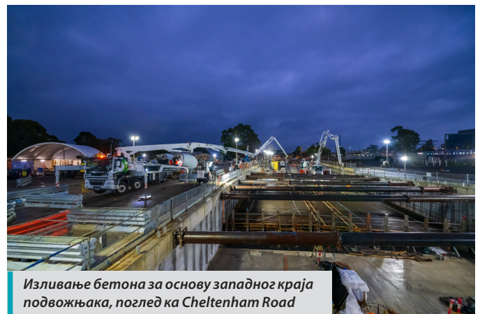
Изливање бетона за основу западног краја подвожњака, поглед ка Cheltenham Road