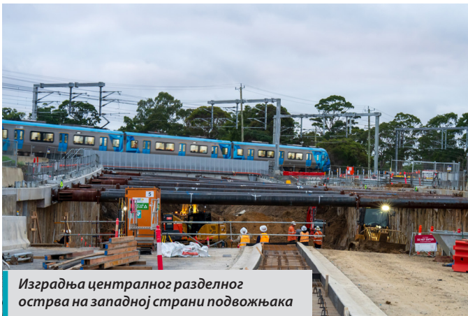
Изградња централног разделног острва на западној страни подвожњака