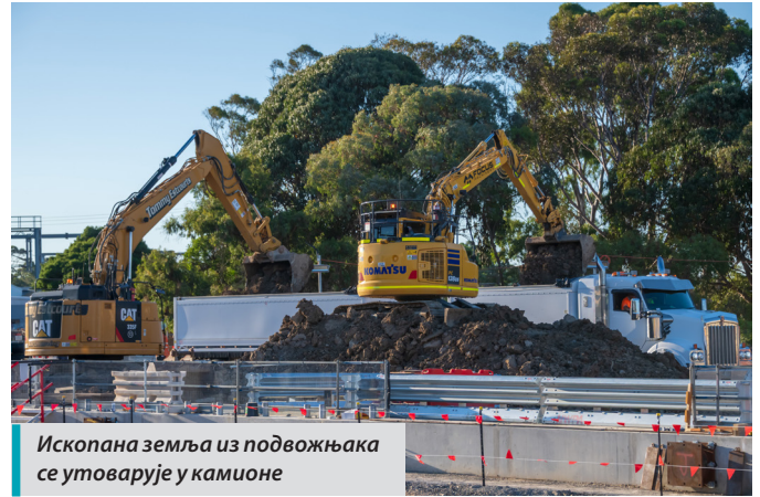
Ископана земља из подвожњака се утоварује у камионе