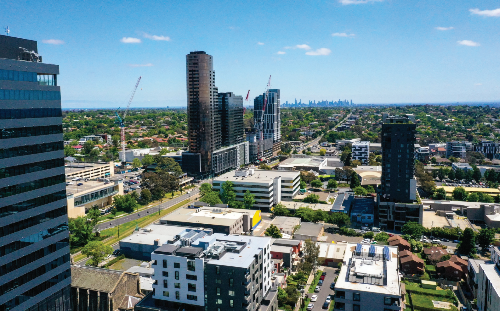
Αεροφωτογραφία του σταθμού SRL East στο Box Hill