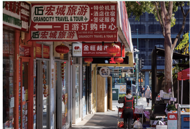
Βιτρίνες μαγαζιών στην οδό Market Street, Box Hill

Τα σχόλιά σας είναι σημαντικά για την οργάνωση και ανάπτυξη του Προαστιακού Σιδηροδρόμου (Suburban Rail Loop) και θα συμβάλει στο να γίνουν οι χώροι κοντά στους σταθμούς του SRL East ακόμη καλύτεροι για κατοικία, εργασία και επίσκεψη.