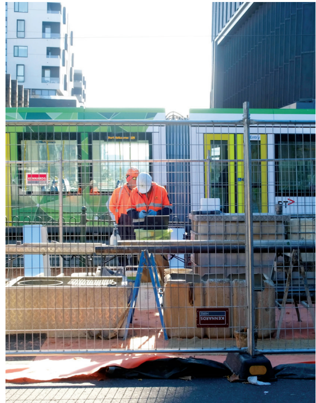
Ερευνες στο χώρο κατασκευής του SRL East στο Box Hill