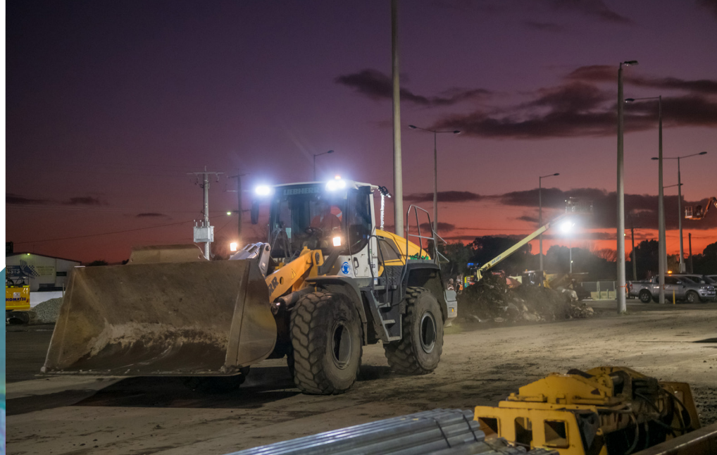
الأعمال الشاقة لبناء الأساسات والركائز في Pakenham Station