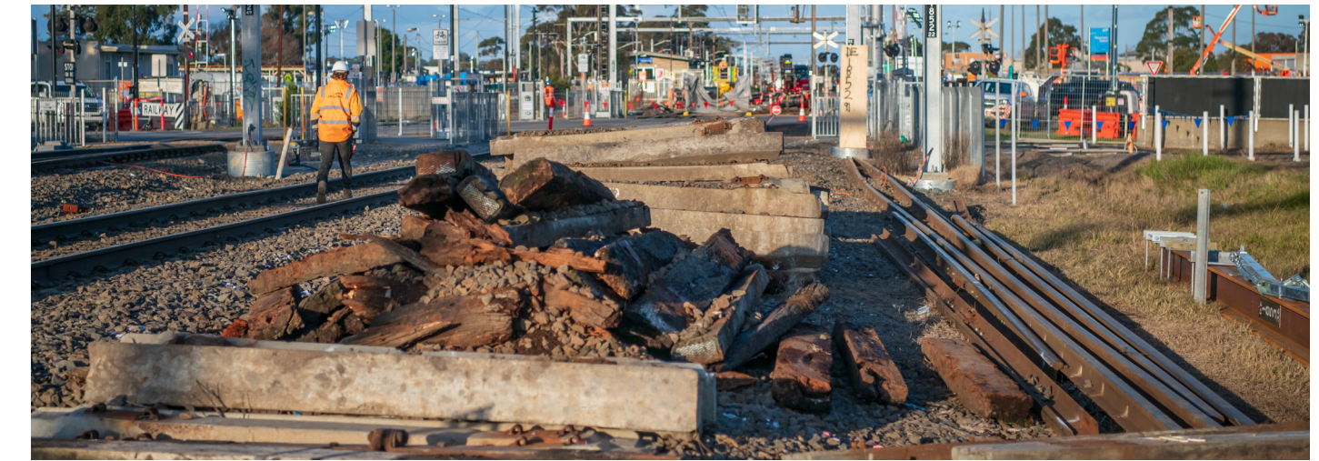
إزالة السكة والعوارض في معبر Main Street السوي