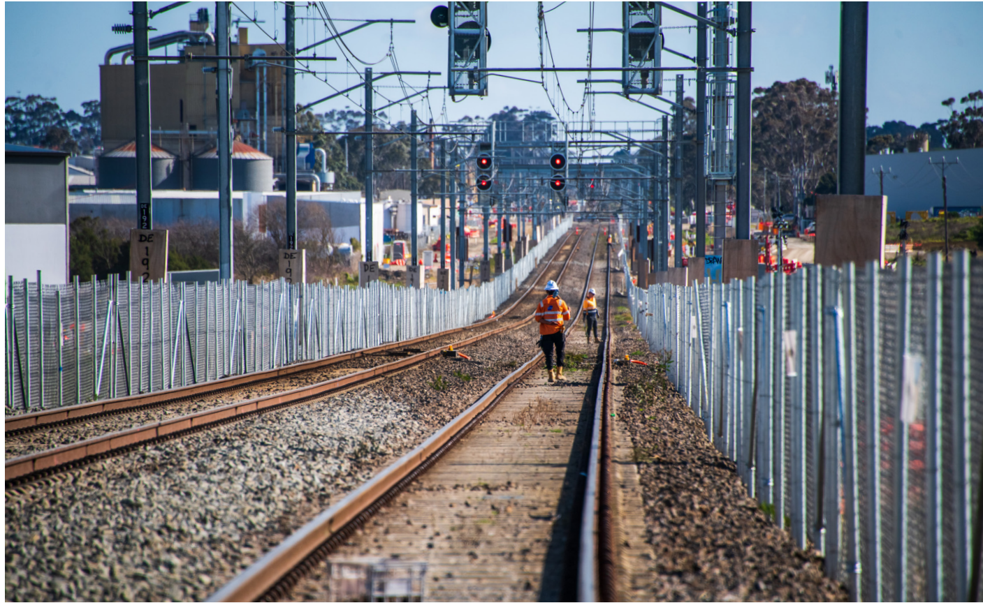
تركيب سياج على طول ممر السكة الحديدية