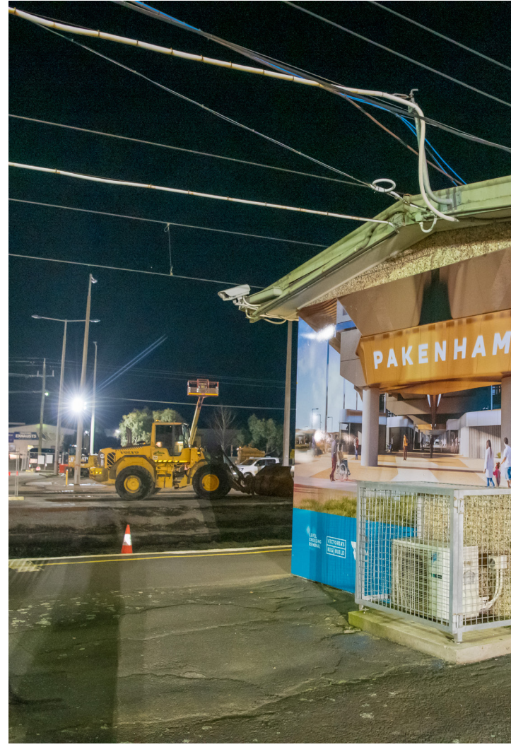
إزالة جوانب السكة وتجهيز الموقع في محطة القطار Pakenham Station