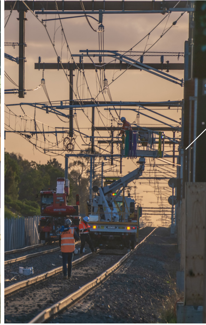
أشغال تجهيزية علوية غرب McGregor Road