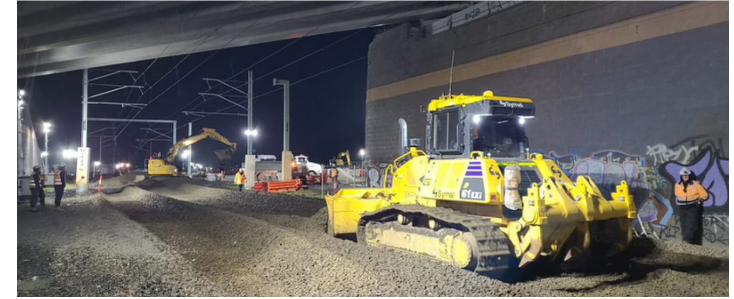
تجديد الصابورة والتربة من تحت خط السكة الحديدية في East Pakenham