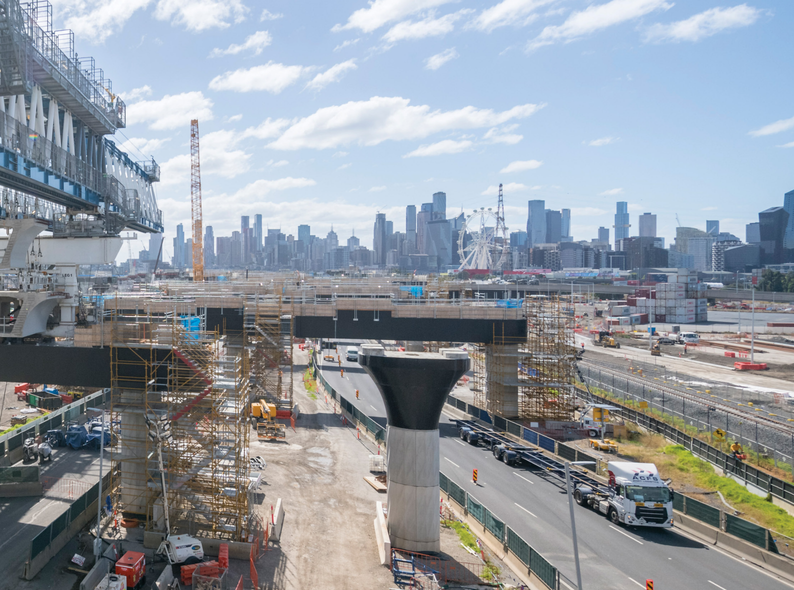
Κατασκευή υπερυψωμένου δρόμου στη Footscray Road