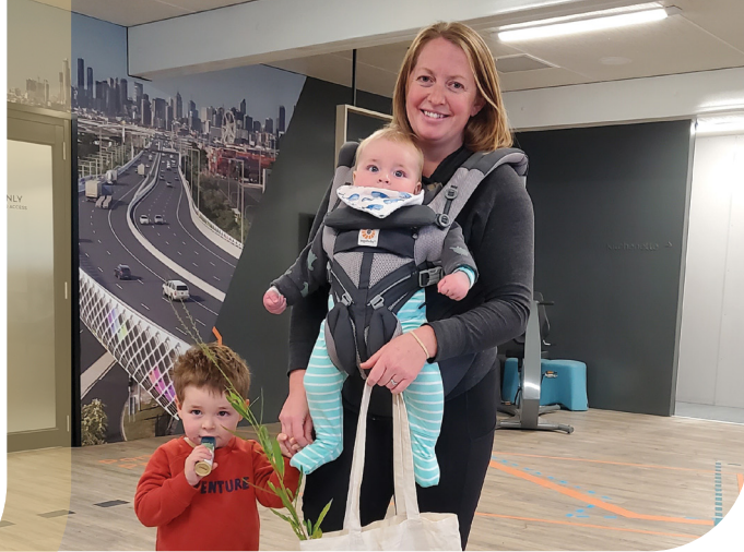
Πρόγραμμα Φύτευσης στην Πίσω Αυλή

Συνολικά, δόθηκαν κουπόνια άνω των $10.000 δωρεάν σε επιλέξιμους κατοίκους.