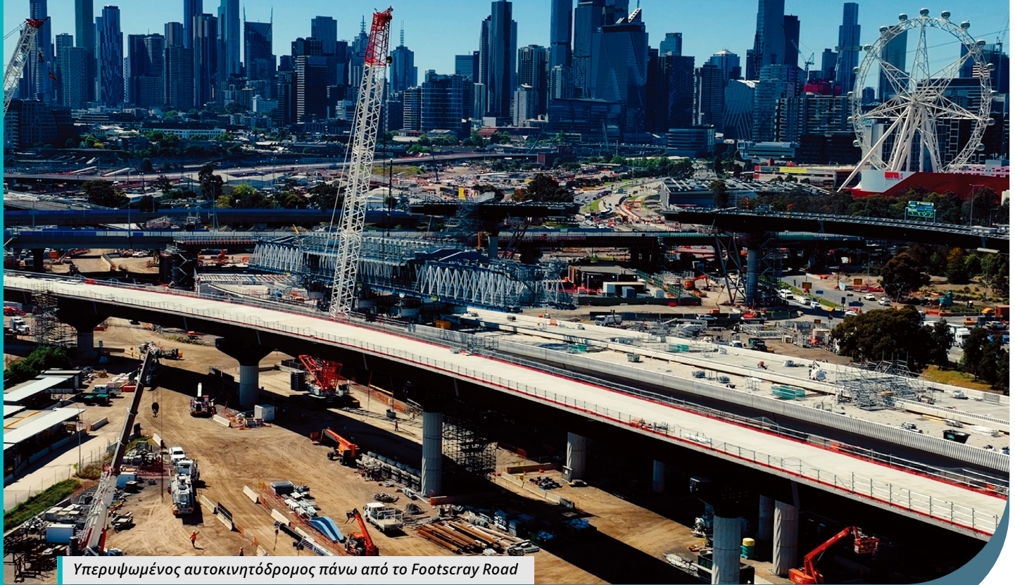
Υπερυψωμένος αυτοκινητόδρομος πάνω από το Footscray Road