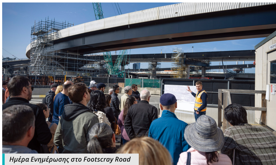
Ημέρα Ενημέρωσης στο Footscray Road

Παρακολουθείτε την ιστοσελίδα μας για μελλοντικές εκδηλώσεις.