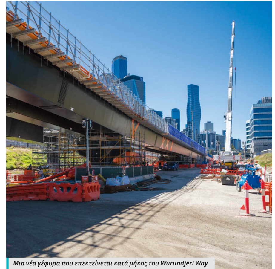
Μια νέα γέφυρα που επεκτείνεται κατά μήκος του Wurundjeri Way

Θα γίνουν περαιτέρω έργα για τη συνέχιση της κατασκευής της παρακαμπτηρίου πόλης αυτό το καλοκαίρι.