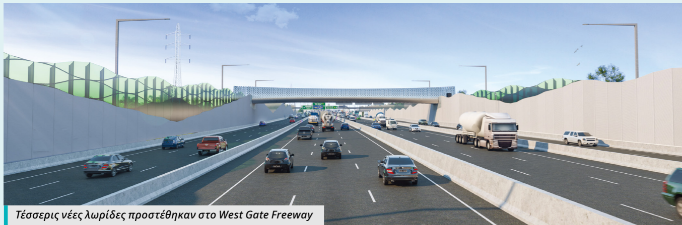
Τέσσερις νέες λωρίδες προστέθηκαν στο West Gate Freeway

Σας ευχαριστούμε για την υπομονή σας κατά την διάρκεια των έργων.