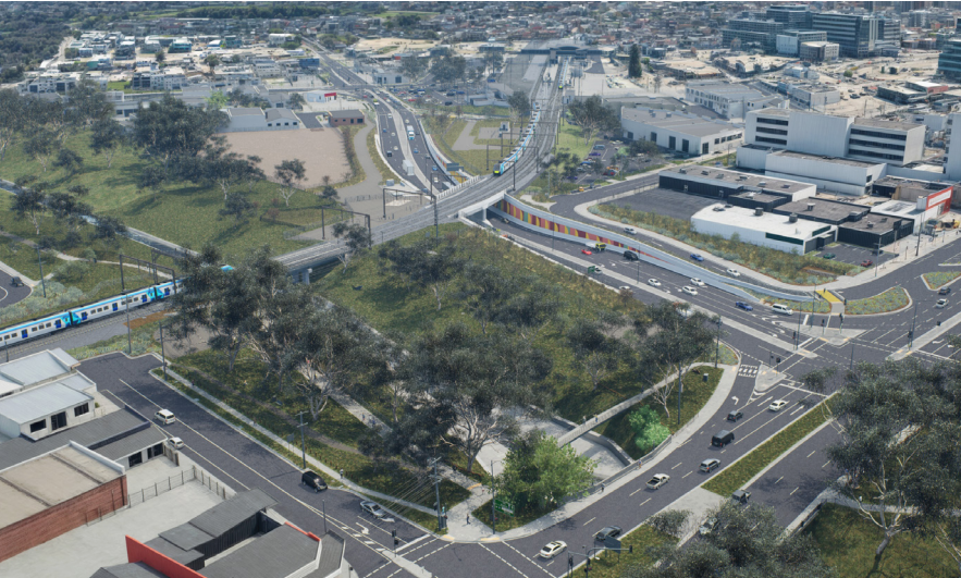
Webster தெருவில் இருக்கும் புகையிரத கடவை மூடப்பட்டது, மேலும் Princes நெடுஞ்சாலை-Lonsdale தெருவில் இருந்து Cheltenham மற்றும் Hammond வீதிகளுக்கு புதிய நிலக் கீழ் வீதி. ஓவியரின் அச்சுப்பதிப்பு, இது மாற்றத்திற்கு உட்பட்டது.

அறிவிப்பு மற்றும் கூடுதல் தகவல்களை எங்கள் வேலைகளுக்கு முன்னால் வழங்குவோம், ஆகையினால் நீங்கள் முன்கூட்டியே திட்டமிடலாம்.