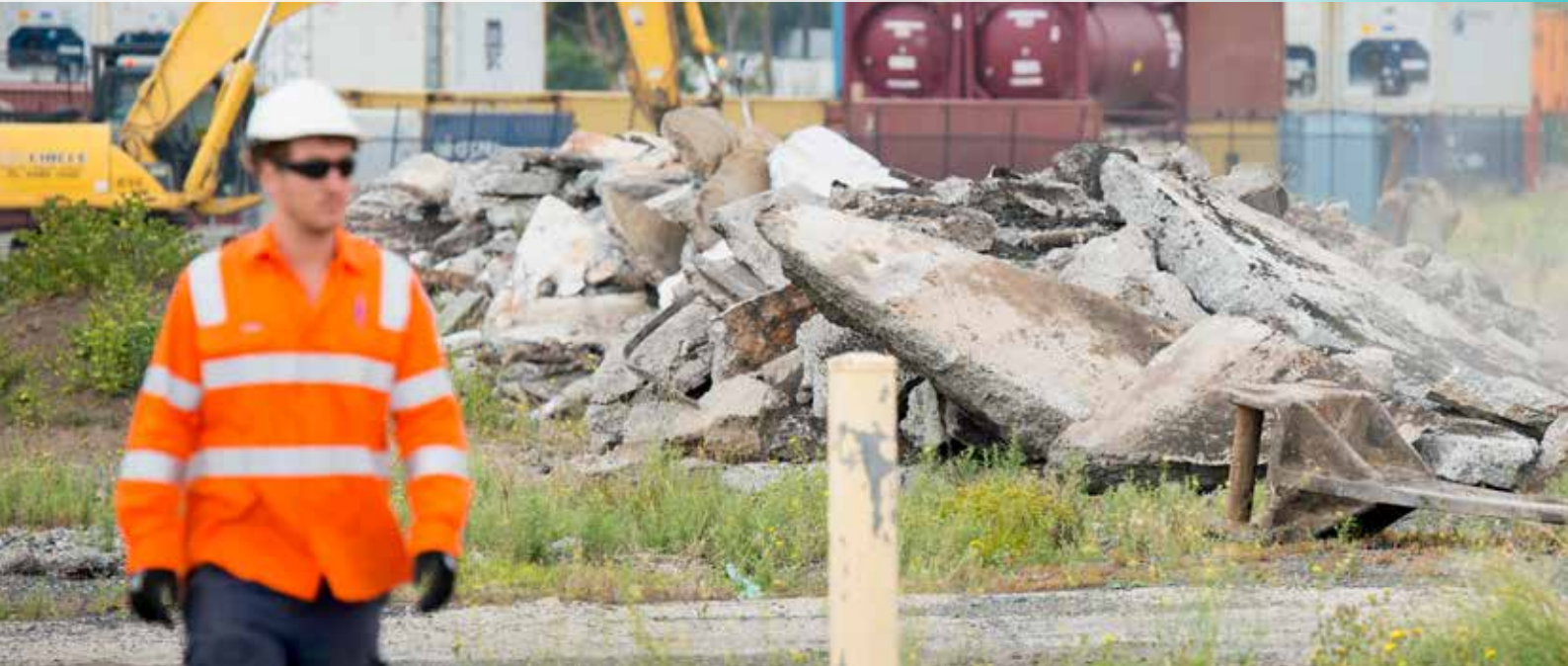
Εργασίες στη Βόρεια Πύλη, Footscray