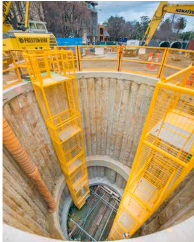
Η μετεγκατάσταση του Κύριου Αποχετευτικού Αγωγού South Yarra για το Έργο της Σήραγγας Μετρό

Για περισσότερες πληροφορίες και το χάρτη της διαδρομής παράκαμψης, ανατρέξτε στο westgatetunnelproject.vic.gov.au