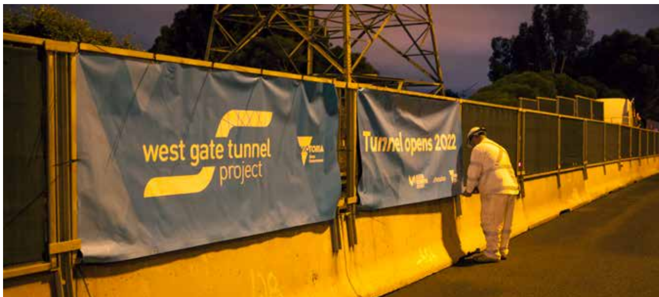
Εργάτες τοποθετούν φράγματα κυκλοφορίας στον αυτοκινητόδρομο.

Για πληροφορίες σχετικά με τις αλλαγές στις συνθήκες κυκλοφορίας και τα επερχόμενα κλεισίματα λωρίδων κυκλοφορίας και λωρίδων εισόδου/εξόδου, ανατρέξτε στο westgatetunnelproject.vic.gov.au