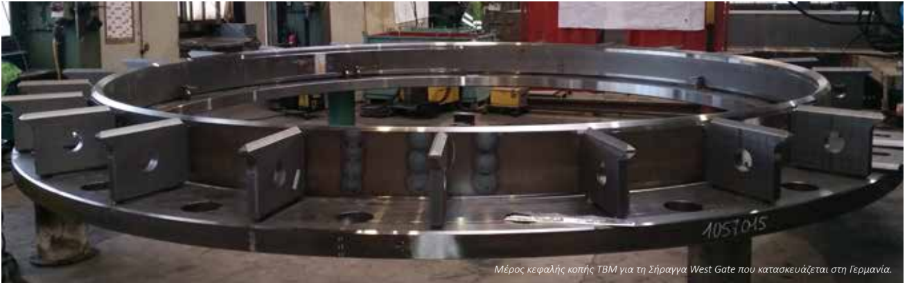
Μέρος κεφαλής κοπής TBM για τη Σήραγγα West Gate που κατασκευάζεται στη Γερμανία.