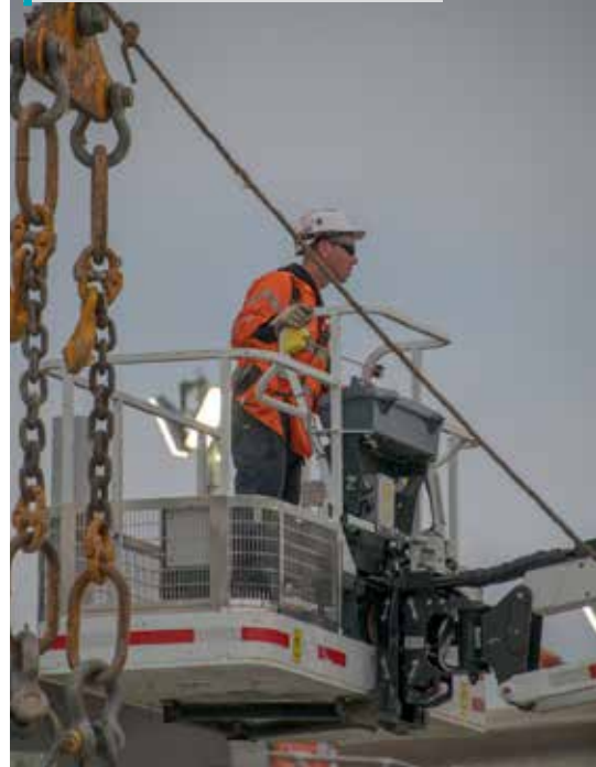
ਕਾਮੇ ਇਹਨਾਂ 'ਤੇ L-ਬੀਮ ਸਥਾਪਤ ਕਰਦੇ ਹਨ ਪਾਕੇਨਹੈਮ ਵਿੱਚ ਮੈਕਗਰੇਗਰ ਰੋਡ

ਰੇਲ ਦੇ ਗਲਿਆਰੇ ਦੇ ਨਾਲ-ਨਾਲ ਸਾਡੇ 24/7 ਕਾਰਜਾਂ ਦੌਰਾਨ, ਸੜਕਾਂ ਨੂੰ ਬੰਦ ਕੀਤਾ ਜਾਵੇਗਾ ਰੇਸਕੋਰਸ ਰੋਡ, ਮੈਕਗਰੇਗਰ ਰੋਡ ਅਤੇ ਮੇਨ ਸਟਰੀਟ ਵਿਖੇ।