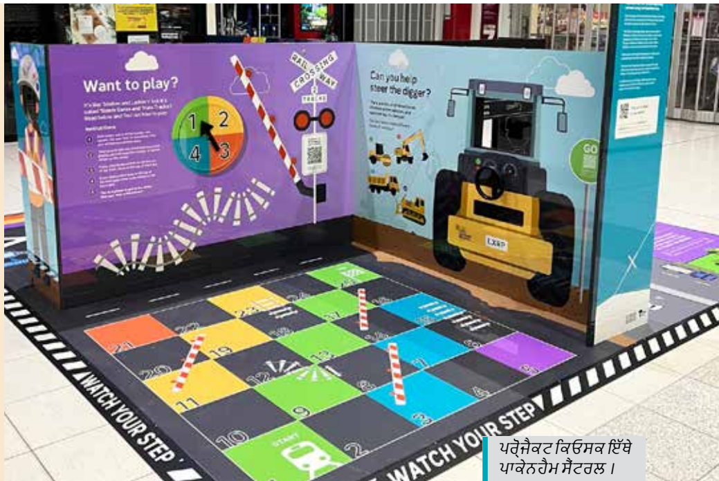
ਪਰੋਜੈਕਟ ਕਿਓਸਕ ਇੱਥੇ ਪਾਕੇਨਹੈਮ ਸੈਂਟਰਲ।

ਇਹ ਯਕੀਨੀ ਬਣਾਓ ਕਿ ਅਗਲੀ ਵਾਰ ਜਦ ਤੁਸੀਂ ਪਾਕੇਨਹੈਮ ਸੈਂਟਰਲ ਵਿਖੇ ਖਰੀਦਦਾਰੀ ਕਰ ਰਹੇ ਹੋਵੋ ਤਾਂ ਤੁਸੀਂ ਇਸਦੀ ਜਾਂਚ ਕਰਦੇ ਹੋ। ਕਿਓਸਕ ਫੂਲਵਰਥਜ਼ ਦੇ ਬਾਹਰ ਸਥਿਤ ਹੈ।