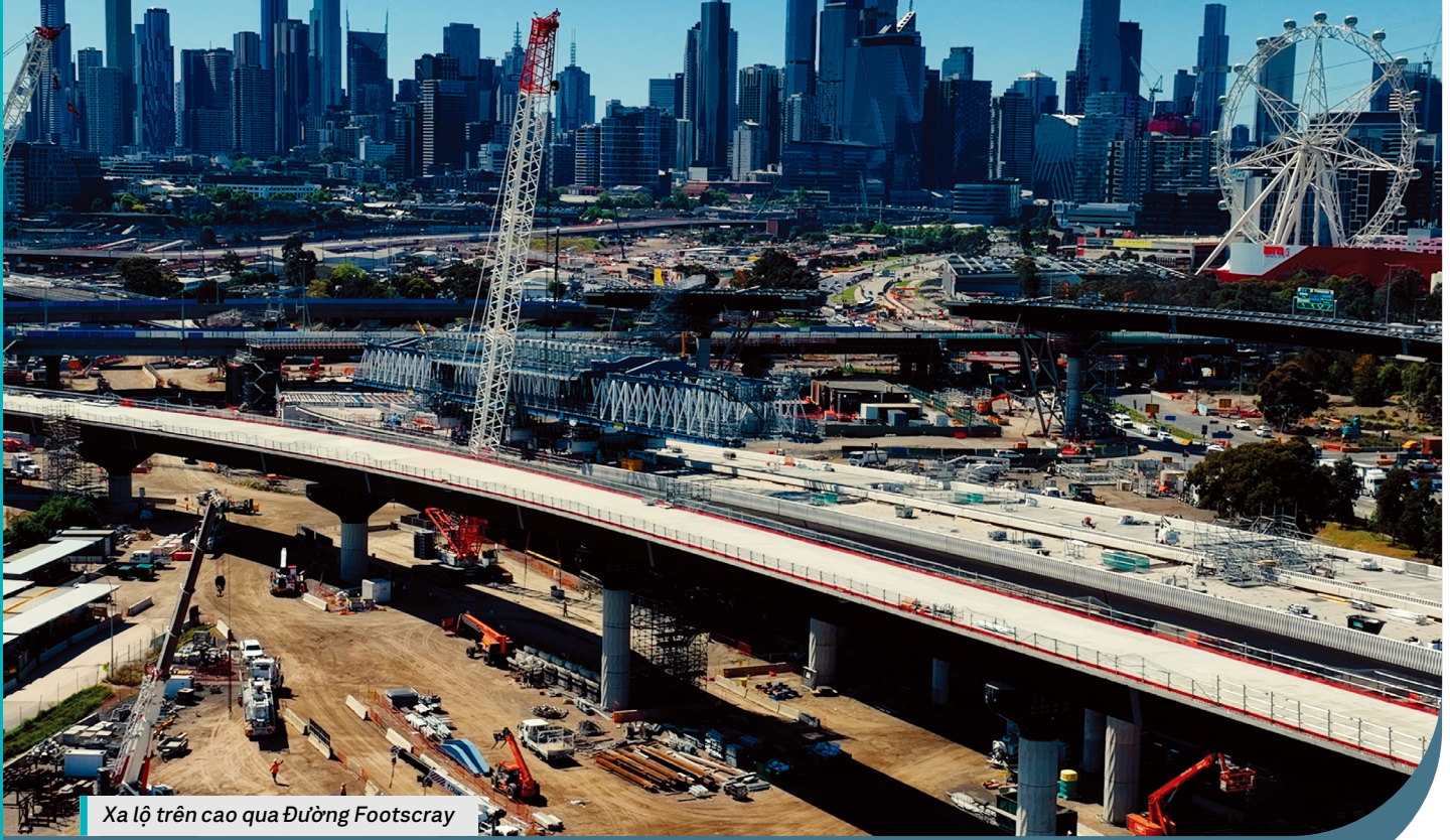
Xa lộ trên cao qua Đường Footscray