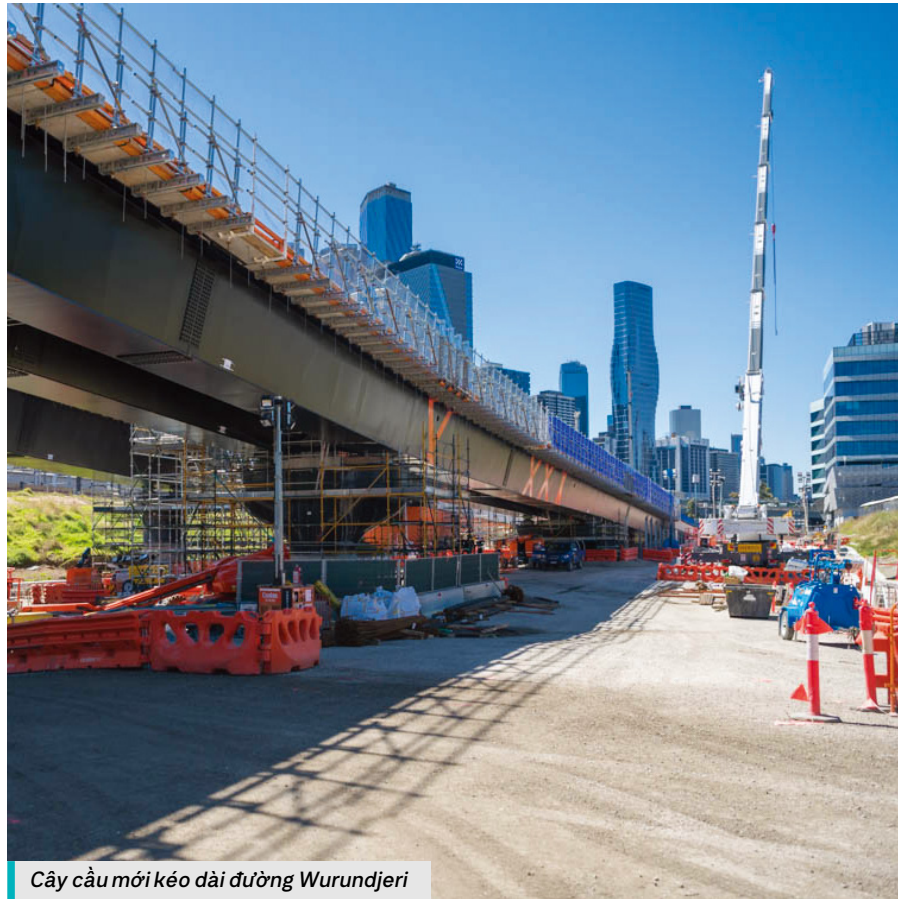
Cây cầu mới kéo dài đường Wurundjeri

Sẽ có thêm công trình thi công để tiếp tục xây dựng đường tránh đi qua thành phố vào mùa hè này.