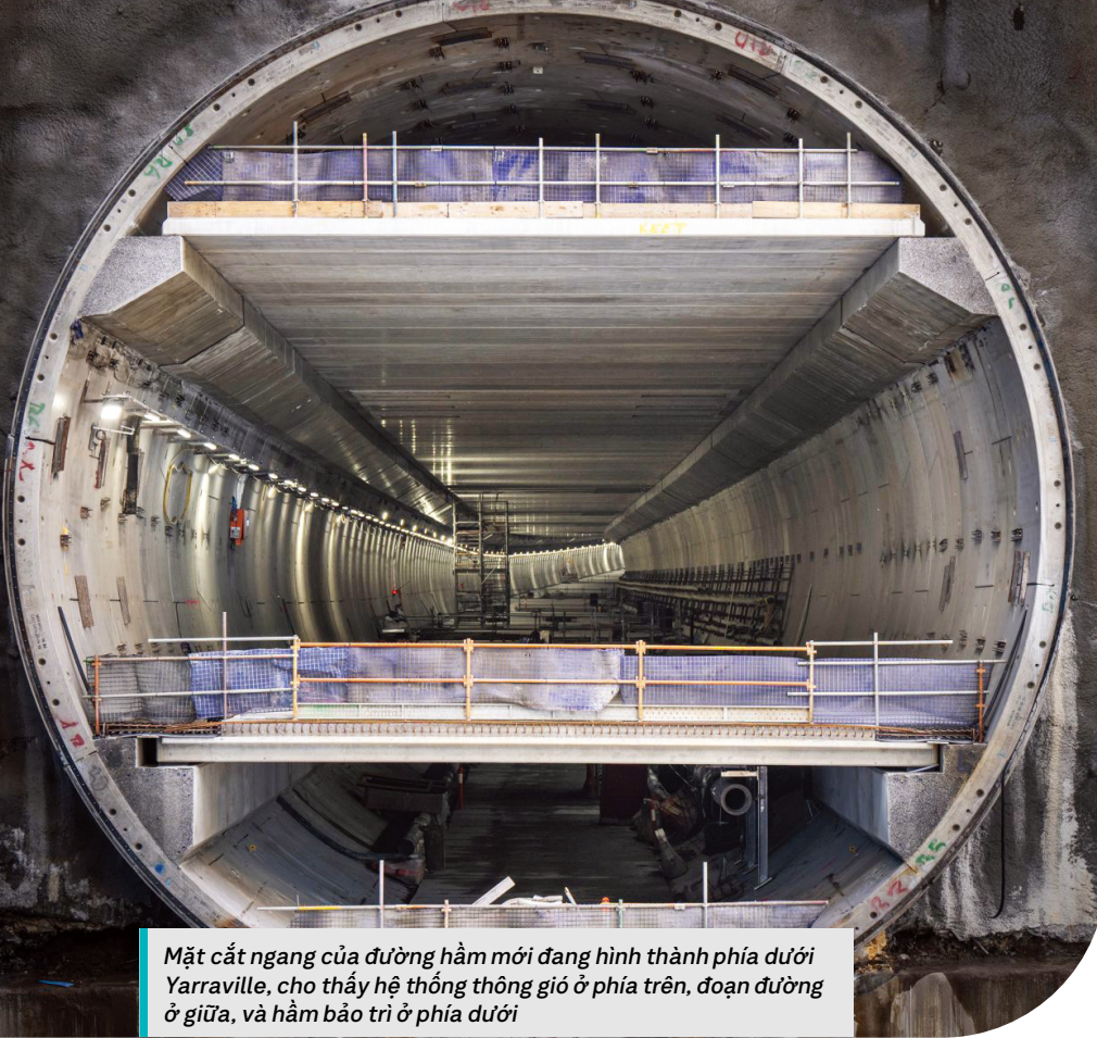
Mặt cắt ngang của đường hầm mới đang hình thành phía dưới Yarraville, cho thấy hệ thống thông gió ở phía trên, đoạn đường ở giữa, và hầm bảo trì ở phía dưới