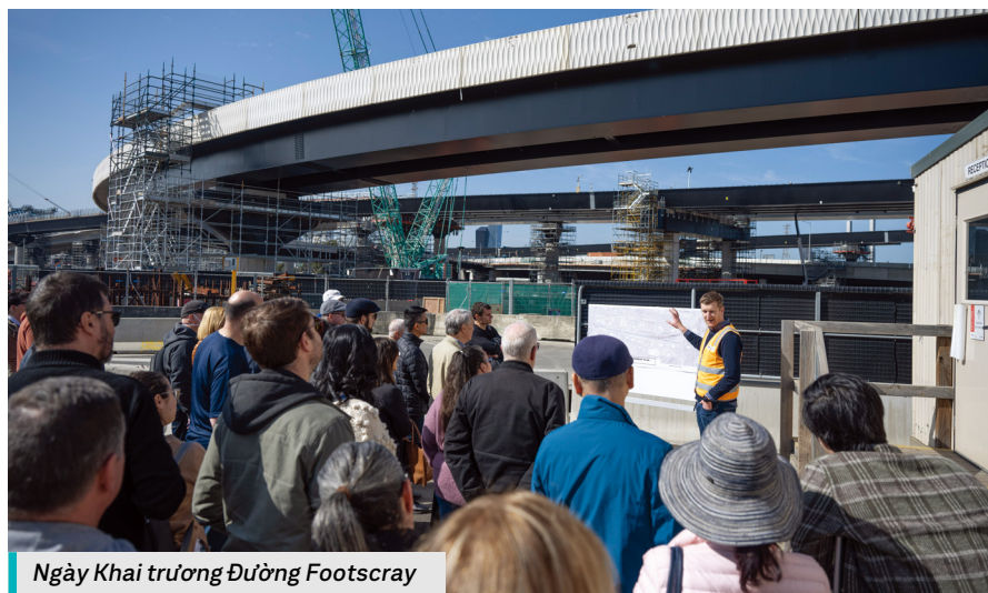
Ngày Khai trương Đường Footscray

Hãy theo dõi trang web của chúng tôi để biết các sự kiện trong tương lai.