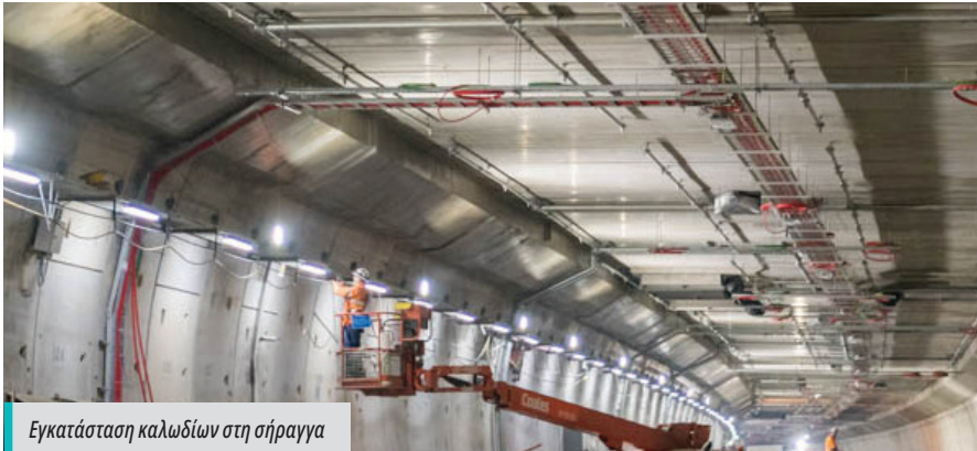
Εγκατάσταση καλωδίων στη σήραγγα

Έξυπνα Συστήματα Μεταφορών [Intelligent Transport Systems] (ITS) - τα οποία είναι εργαλεία που βελτιώνουν την ασφάλεια, την αποδοτικότητα και τη βιωσιμότητα του οδικού δικτύου