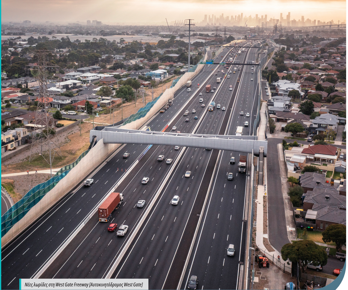
Νέες λωρίδες στη West Gate Freeway [Αυτοκινητόδρομος West Gate]