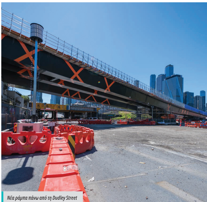
Νέα ράμπα πάνω από τη Dudley Street