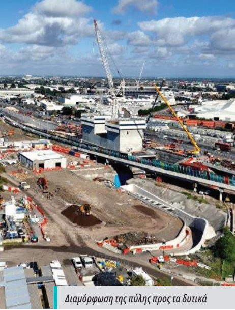
Διαμόρφωση της πύλης προς τα δυτικά