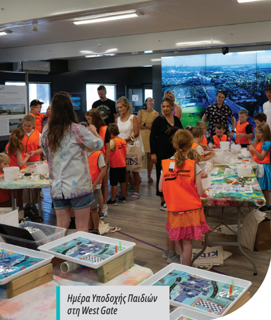
Ημέρα Υποδοχής Παιδιών στη West Gate