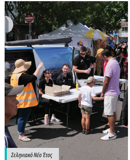
Σεληνιακό Νέο Έτος

Καθώς το έργο πλησιάζει στην ολοκλήρωσή του, θα συνεχίσουμε να βρισκόμαστε κοντά στην κοινότητα, οπότε έχετε το νου σας για την επόμενη στάση μας, στην επόμενη αυθόρμητη εκδήλωση ή σε κάποια κοινωνική δραστηριότητα.