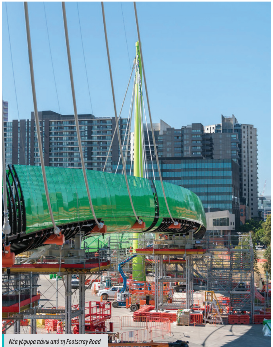
Νέα γέφυρα πάνω από τη Footscray Road

Κατόπιν τα συνεργεία εγκατέστησαν ασφάλινες δοκούς 482 τόννων πάνω από τη Footscray Road και τελικά ολοκλήρωσαν την κατασκευή της γέφυρας εγκαθιστώντας τα υποστηρικτικά καλώδια.