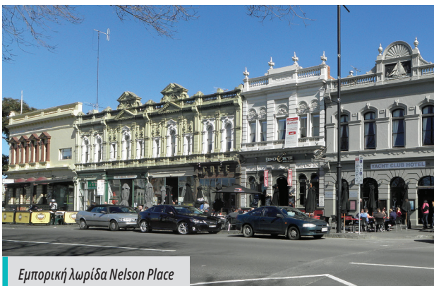
Εμπορική λωρίδα Nelson Place