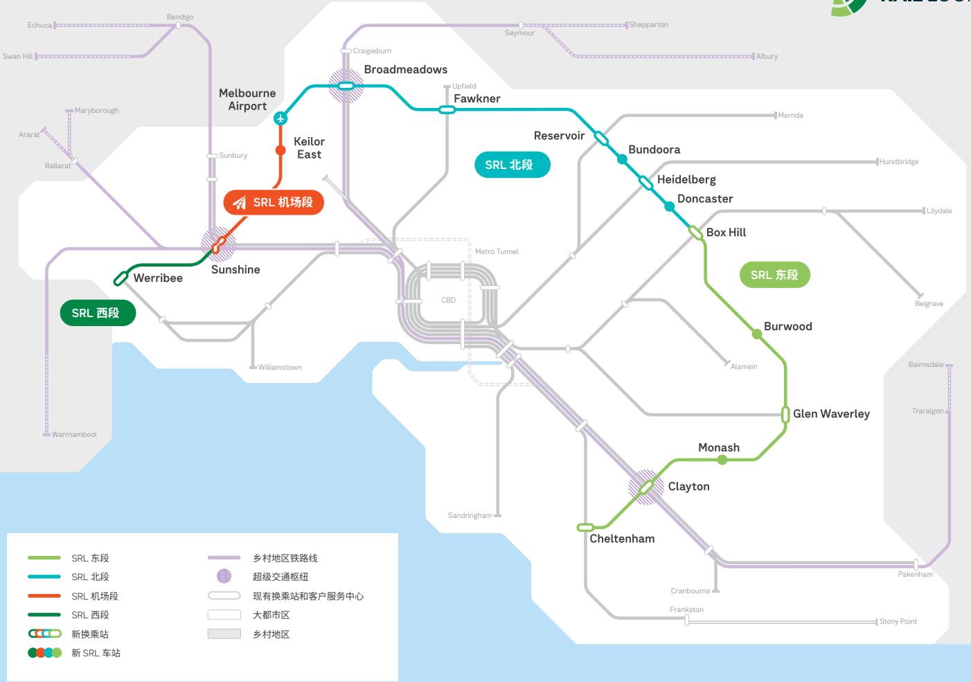
仅供说明用途，有待进一步详细的技术调查和咨询

Work is progressing on Suburban Rail Loop and 2024 is the project's busiest year yet. We have translated this newsletter into other languages to keep everyone updated about Suburban Rail Loop news.