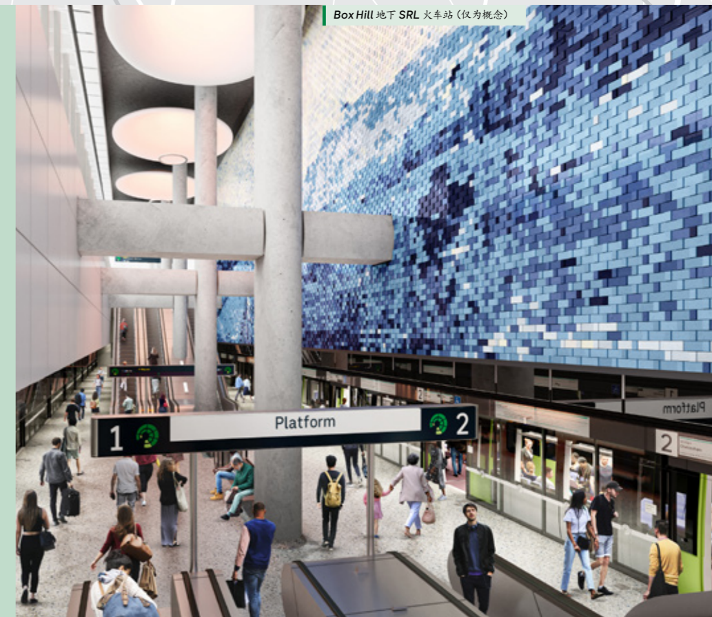
Box Hill 地下 SRL 火车站 (仅为概念)

SRL 站将与现有的 Box Hill 站之间建立快速便捷的通道，换乘时无需刷卡。到 2035 年，列车将开始载客。