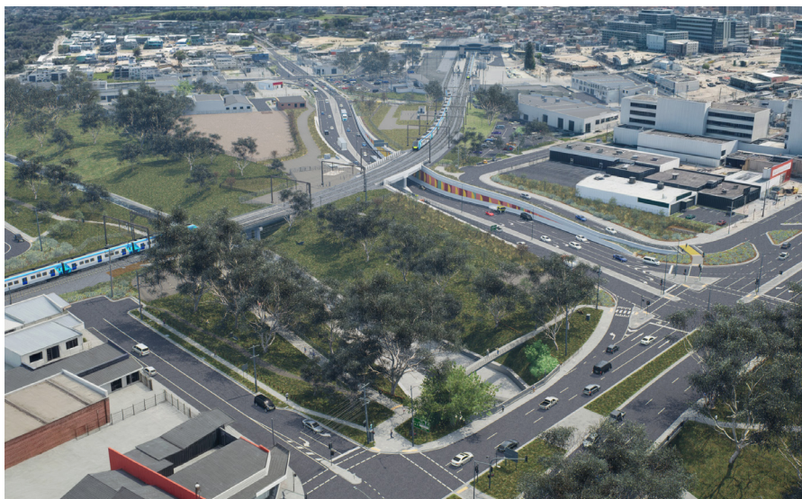
Đường Webster Street bị đóng tại công xe lửa, và đường hầm mới từ Princes Highway-Lonsdale Street đến các đường Cheltenham Road và Hammond Road. Hình ảnh minh họa, có thể thay đổi.

Khi công việc xây dựng bắt đầu, bạn sẽ thấy nhiều công nhân và phương tiện hơn, bao gồm các khu nhà tạm và khu vực cho thiết bị và vật liệu. Chúng tôi sẽ thông báo trước và nhiều thông tin hơn về công việc để bạn có thể lên kế hoạch trước.