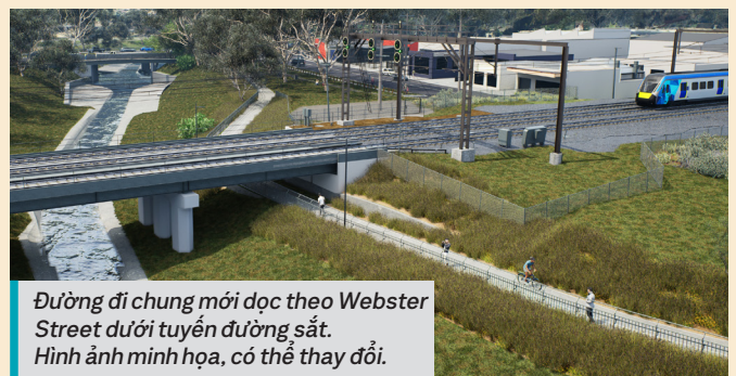
Đường đi chung mới dọc theo Webster Street dưới tuyến đường sắt. Hình ảnh minh họa, có thể thay đổi.

Bạn cho chúng tôi biết rằng bạn muốn có kết nối tốt hơn cho người đi bộ và xe đạp. Trước khi công xe lửa ở đường Webster Street bị đóng vào năm 2025, chúng tôi sẽ xây dựng một đường đi chung mới dọc theo đường Webster Street dưới tuyến đường sắt.