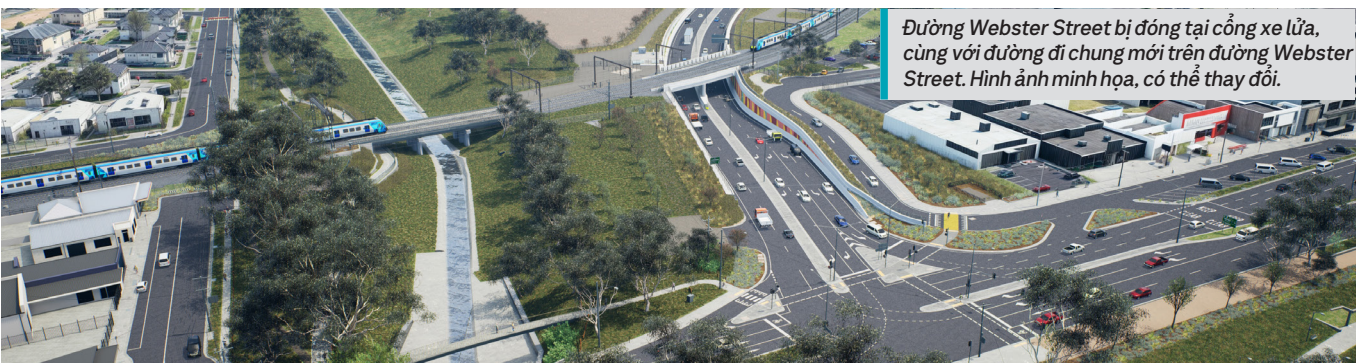
Đường Webster Street bị đóng tại cổng xe lửa, cùng với đường đi chung mới trên đường Webster Street. Hình ảnh minh họa, có thể thay đổi.