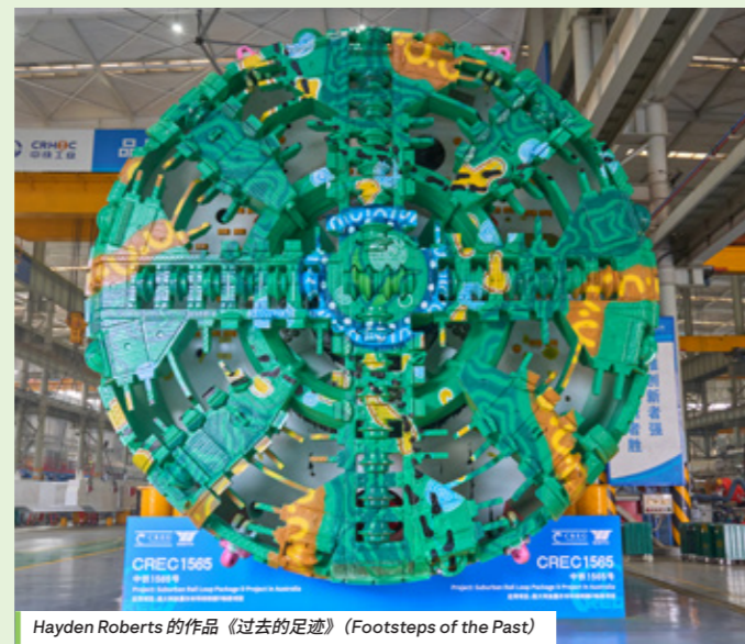
Hayden Roberts 的作品《过去的足迹》(Footsteps of the Past)