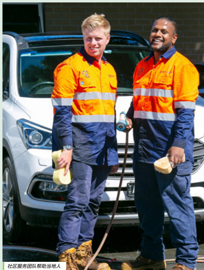
社区服务团队帮助当地人

该团队目前已累计完成 500 项任务，表现惊人，其中包括在 Heatherton 和 Clarinda 开展的 350 多项任务。衷心感谢团队的辛勤付出、敬业精神以及对社区的持续支持。