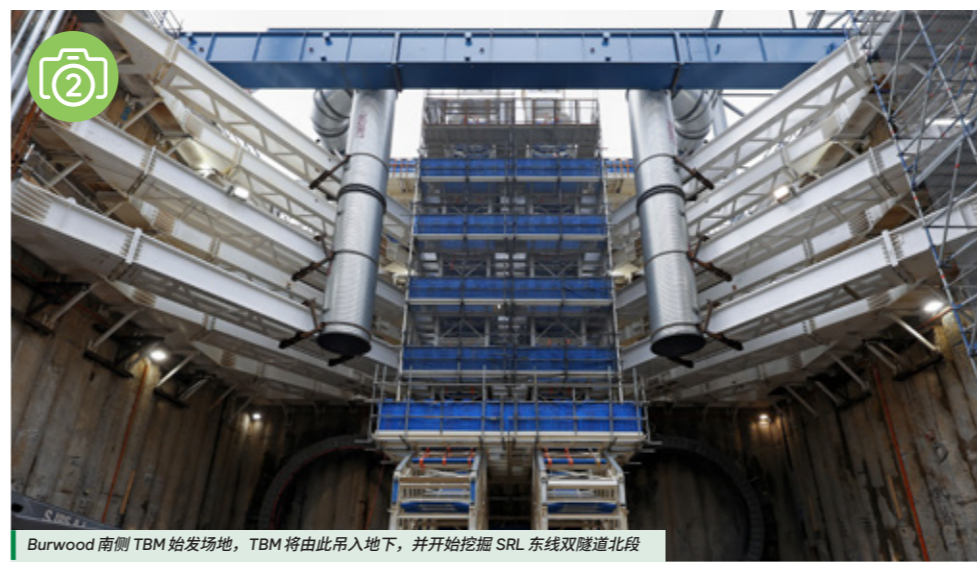
Burwood 南侧 TBM 始发场地，TBM 将由此吊入地下，并开始挖掘 SRL 东线双隧道北段