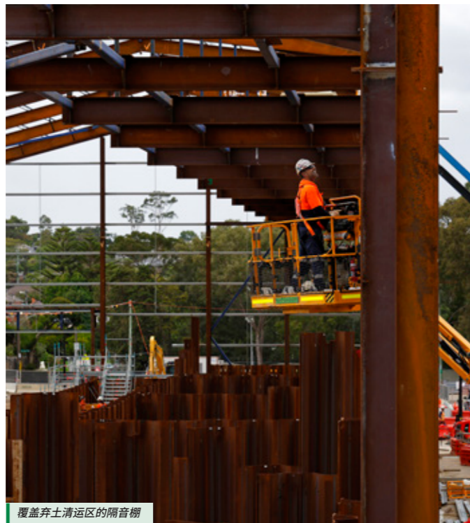
覆盖弃土清运区的隔音棚

这些钢结构隔音棚将在 24 小时隧道施工期间封闭噪音设备和作业活动，有助于减少施工噪音对周边住宅和商铺的影响。