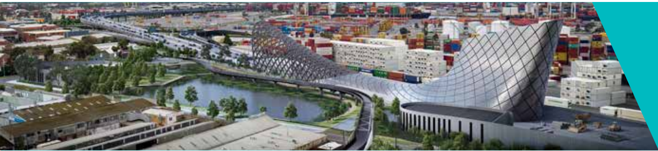
Cửa đường hầm phía bắc, Footscray