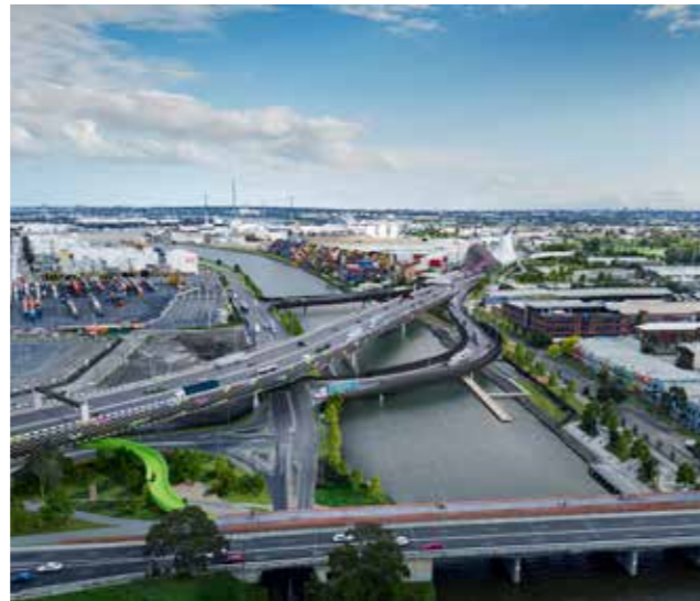
Cây cầu mới bắc qua sông Maribyrnong và các con đường dọc MacKenzie Road Họa sĩ minh họa - không bao gồm thiết kế chi tiết