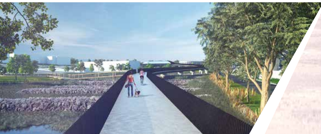
Lối đi mới và vùng đất ngập nước, Footscray

Trong những tuần tới, chúng tôi sẽ đi đây đi đó trong cộng đồng quý vị, vì vậy, quý vị có thể đến và xem thiết kế này và đặt câu hỏi trước khi Environment Effects Statement được công bố vào giữa năm 2017.