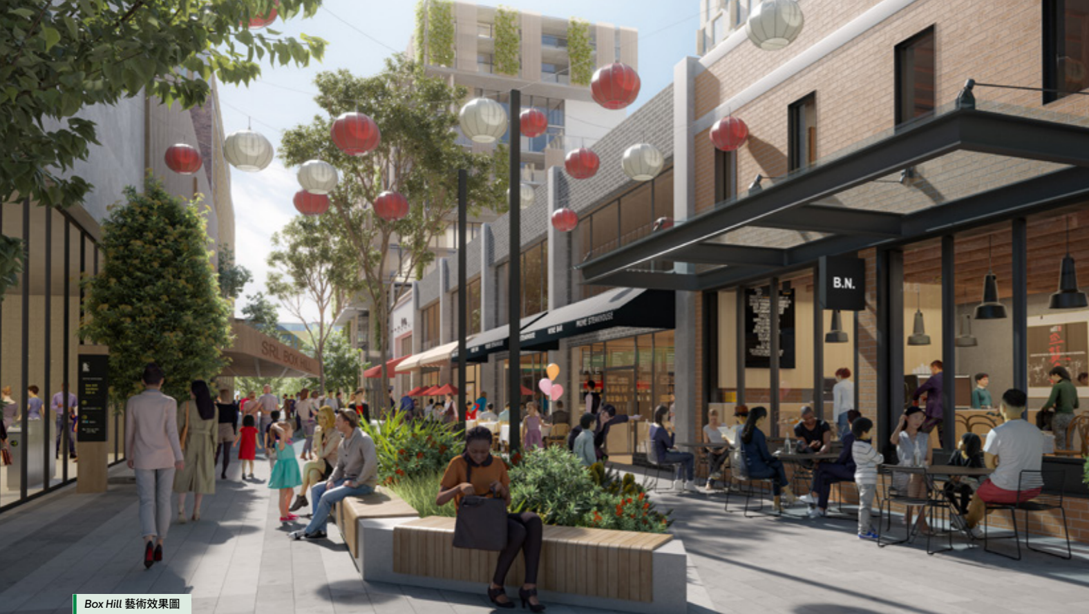
Box Hill 藝術效果圖