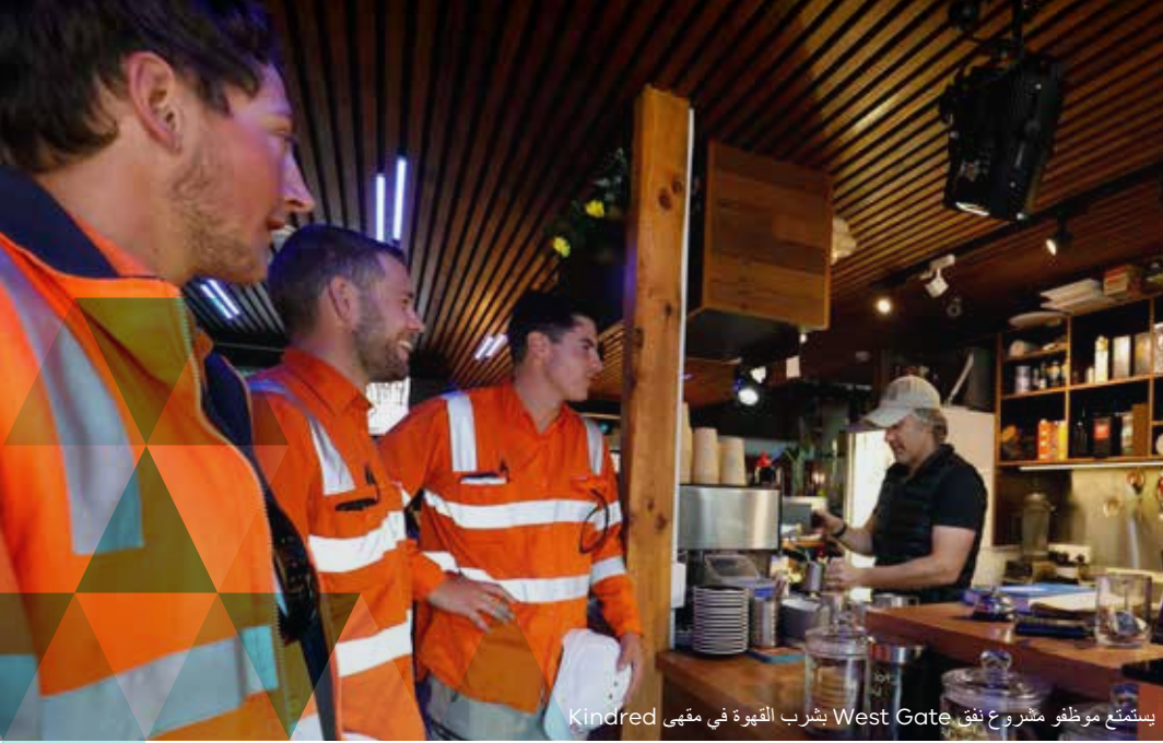
يستمتع موظف مشروع نفق West Gate بشرب القهوة في مقهى Kindred

وسيؤدي نقل شبكة الصرف الصحي الرئيسية في شمال يارا على شارع Whitehall Footscray/ في Street Yarraville إلى رؤية تحويلات في المرور في المنطقة لمدة 12 شهراً.