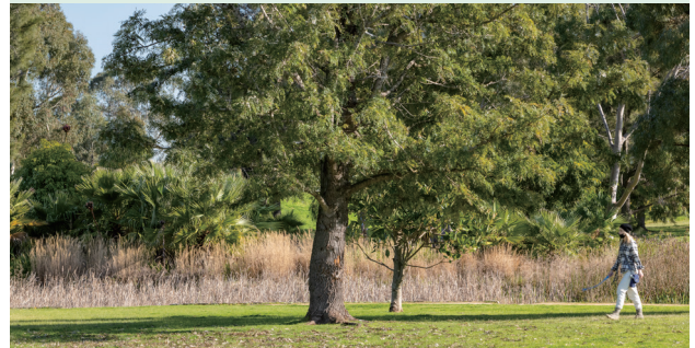
Sir William Fry Reserve, Cheltenham

Τα σχόλιά σας είναι σημαντικά για την οργάνωση και ανάπτυξη του Προαστιακού Σιδηροδρόμου (Suburban Rail Loop) και θα συμβάλει στο να γίνουν οι χώροι κοντά στους σταθμούς του SRL East ακόμη καλύτεροι για κατοικία, εργασία και επίσκεψη.