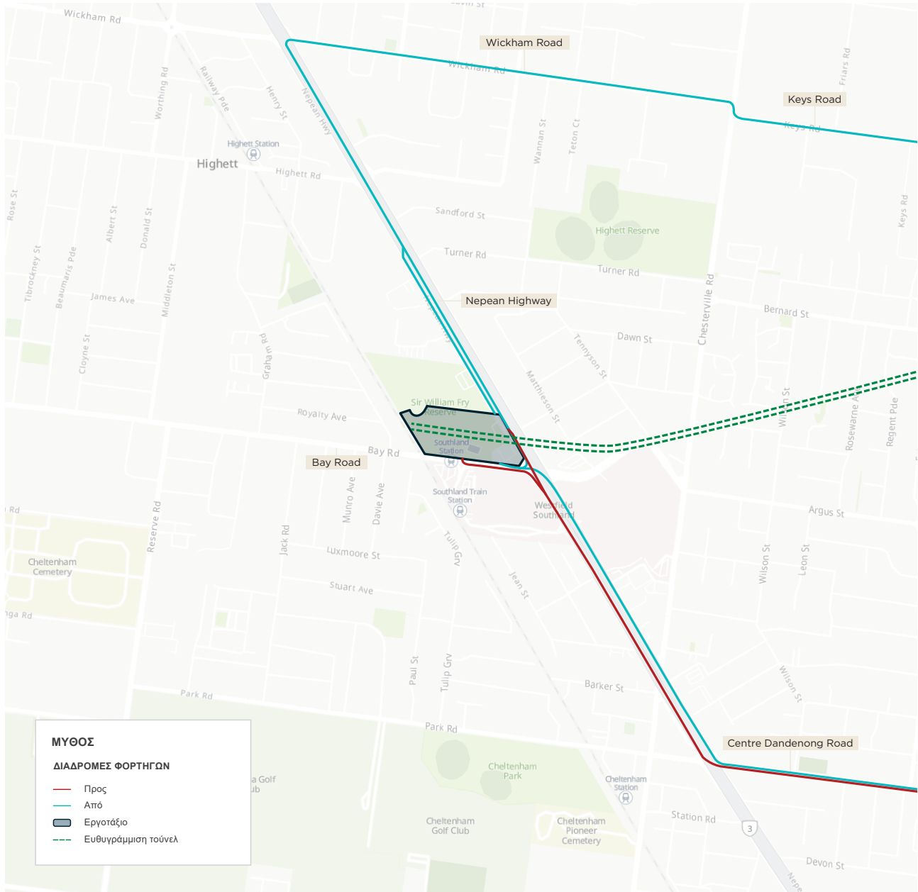
Σχήμα 3: Διαδρομές οχημάτων της κύριας κατασκευής στο Cheltenham