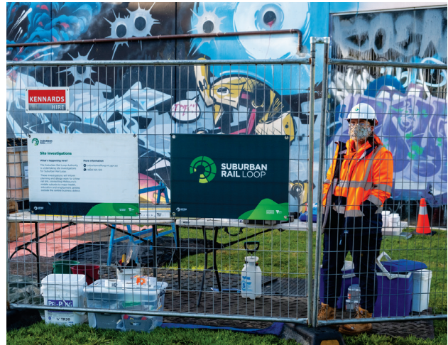
Έρευνες στο χώρο κατασκευής του SRL East στο Cheltenham