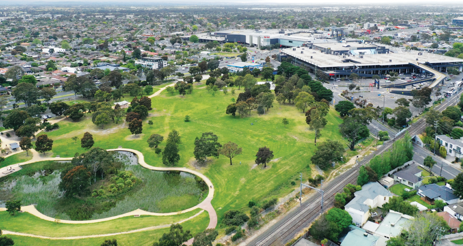
Αεροφωτογραφία του σταθμού SRL East στο Cheltenham