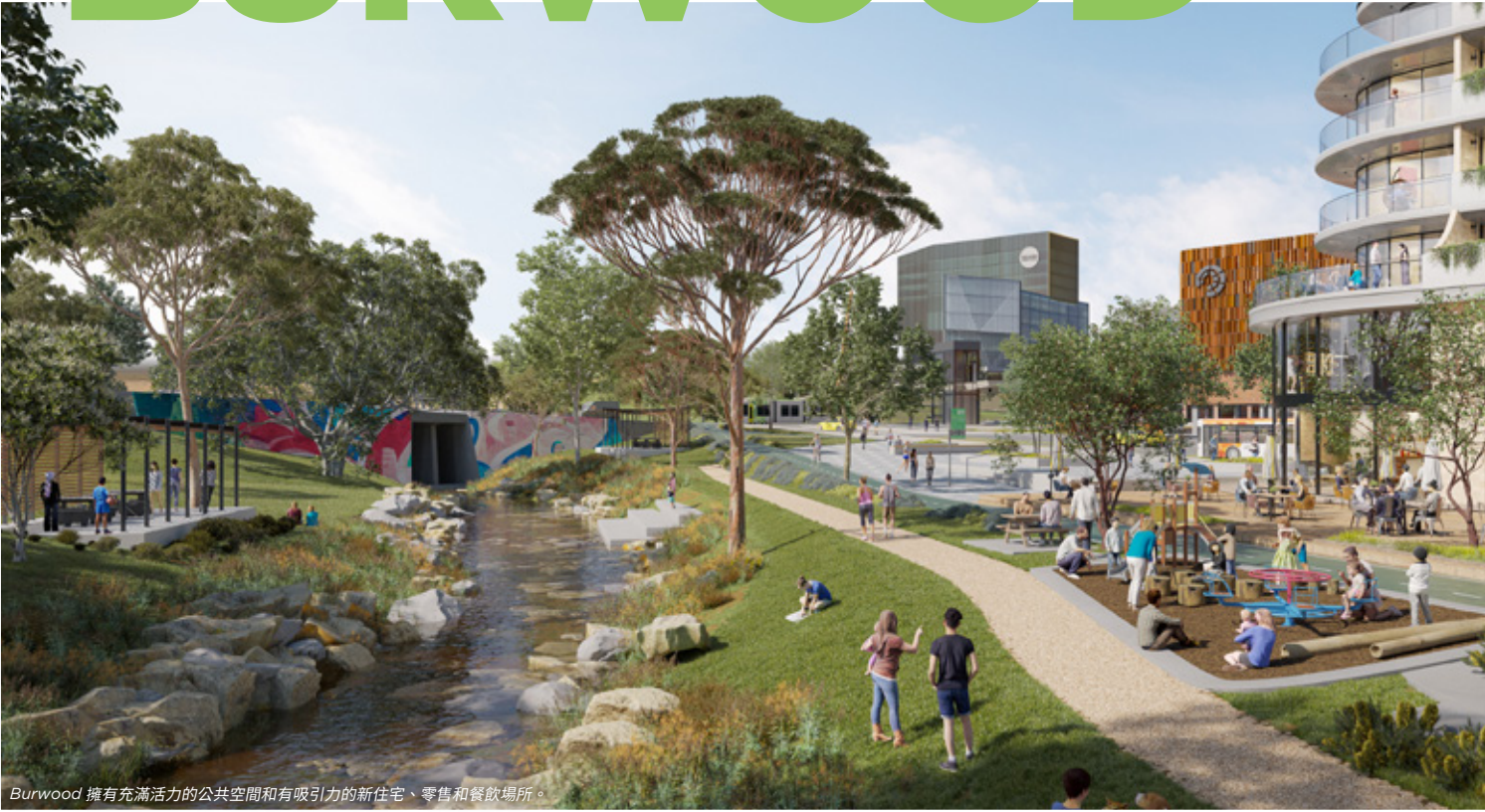
Burwood 擁有充滿活力的公共空間和有吸引力的新住宅、零售和餐飲場所。