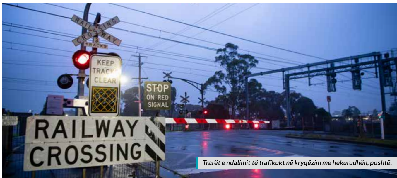
Trarët e ndalimit të trafikut në kryqëzim me hekurudhën, poshtë.

Skani kodin QR ose shikoni: levelcrossings.vic.gov.au/webster-street për ta lexuar raportin e konsultimit.