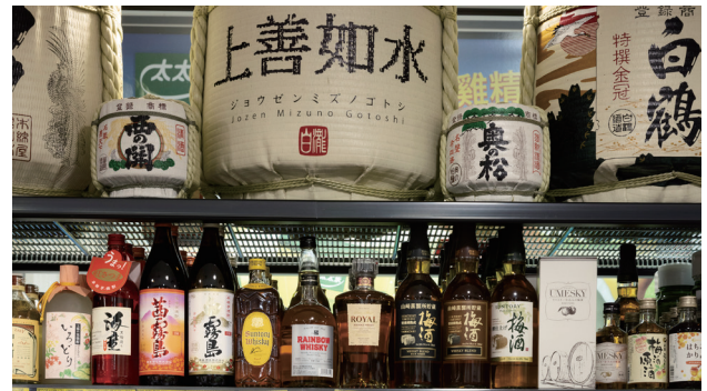
Κατάστημα με σπεσιαλιτέ τρόφιμα στο Clayton

Τα σχόλιά σας είναι σημαντικά για την οργάνωση και ανάπτυξη του Προαστιακού Σιδηροδρόμου (Suburban Rail Loop) και θα συμβάλει στο να γίνουν οι χώροι κοντά στους σταθμούς του SRL East ακόμη καλύτεροι για κατοικία, εργασία και επίσκεψη.