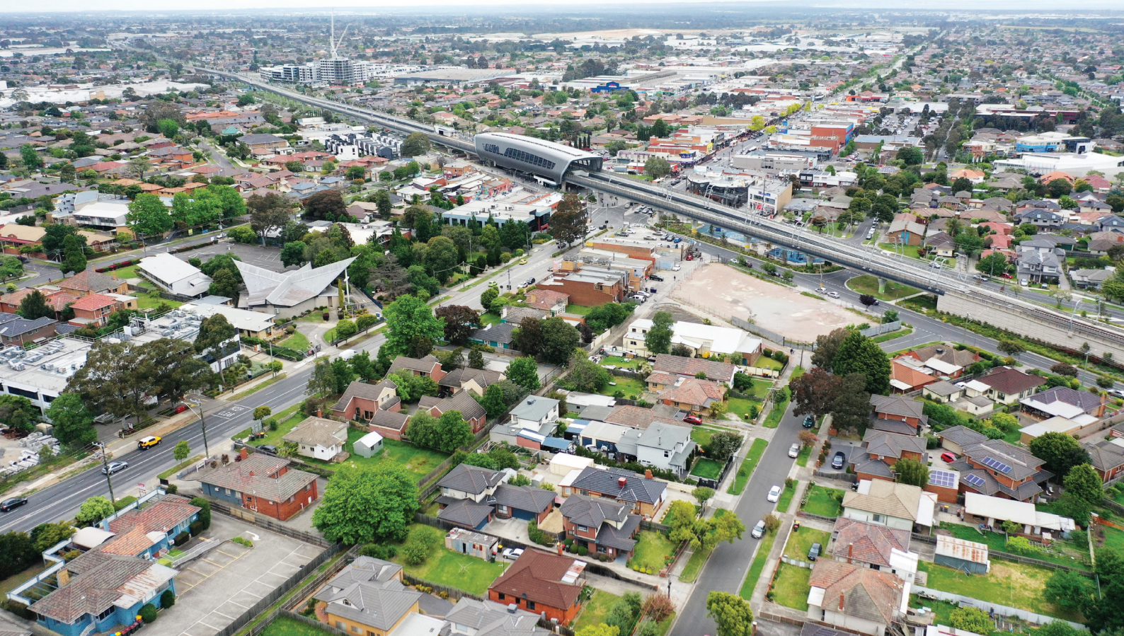
Αεροφωτογραφία του σταθμού SRL East στο Clayton