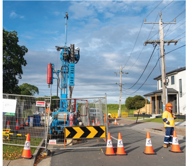
Ερευνες στο χώρο κατασκευής του SRL East στο Clayton