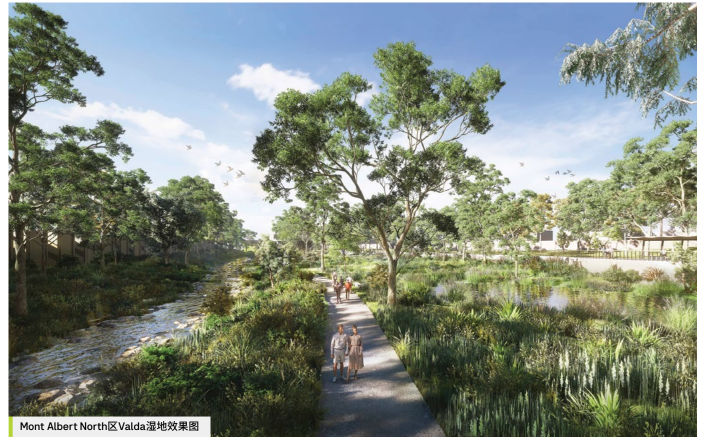
Mont Albert North区Valda湿地效果图