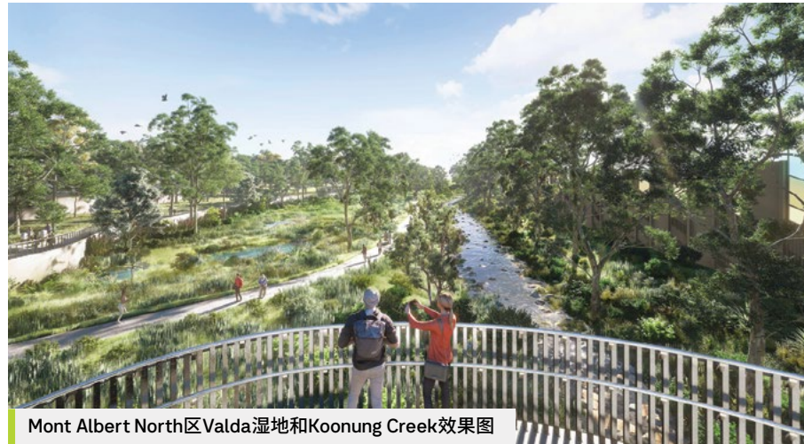
Mont Albert North区Valda湿地和Koonung Creek效果图