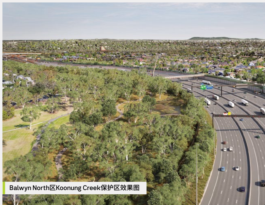
Balwyn North区Koonung Creek保护区效果图

我们会在修复东部高速路升级项目所需的保护区区域时，完成该总体规划的主要内容，包括步行和骑行道、更新健身设施、凉亭以及新的景观设计。您可在当前公示的UDLP中看到这其中的部分元素。