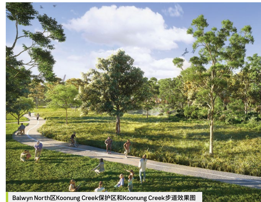
Balwyn North区Koonung Creek保护区和Koonung Creek步道效果图