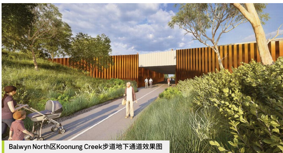
Balwyn North区Koonung Creek步道地下通道效果图