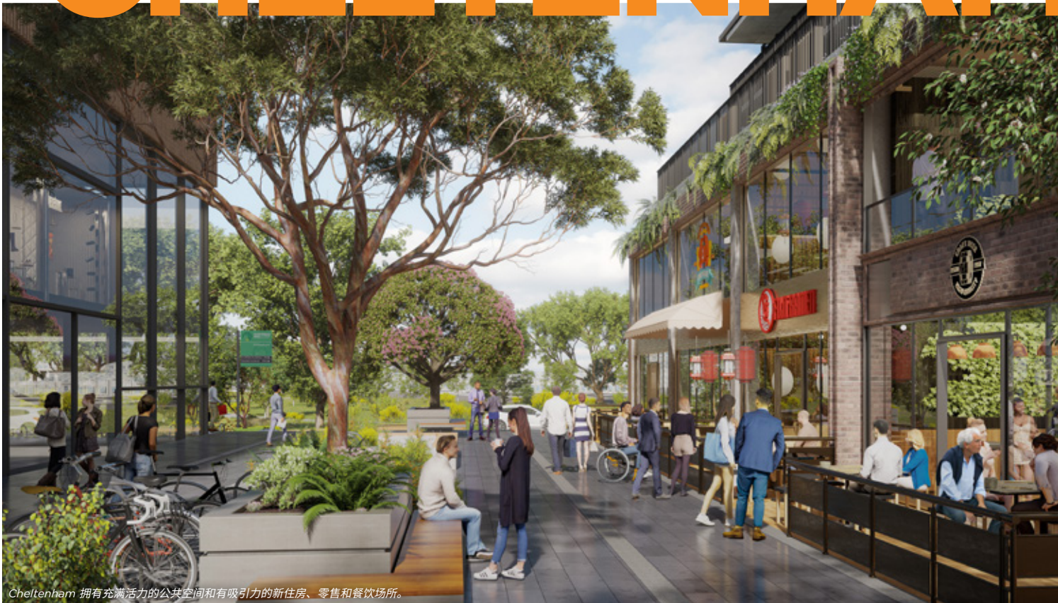
Cheltenham 拥有充满活力的公共空间和有吸引力的新住房、零售和餐饮场所。