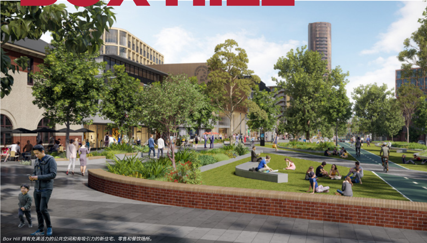
Box Hill 拥有充满活力的公共空间和有吸引力的新住宅、零售和餐饮场所。