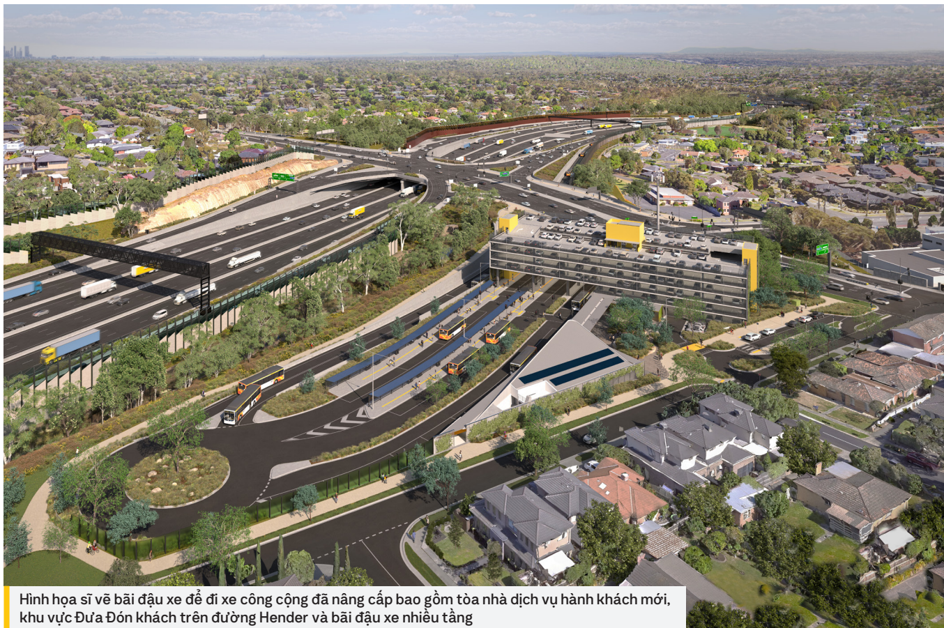
Hình họa sĩ vẽ bãi đậu xe để đi xe công cộng đã nâng cấp bao gồm tòa nhà dịch vụ hành khách mới, khu vực Đưa Đón khách trên đường Hender và bãi đậu xe nhiều tầng

Chúng tôi đang nâng cấp Bãi Đậu xe để Đi xe Công cộng Doncaster và kết nối với tuyến xe buýt chuyên dụng đầu tiên của Melbourne để giảm thời gian đi lại và cải thiện giao thông công cộng ở vùng phía đông Melbourne.