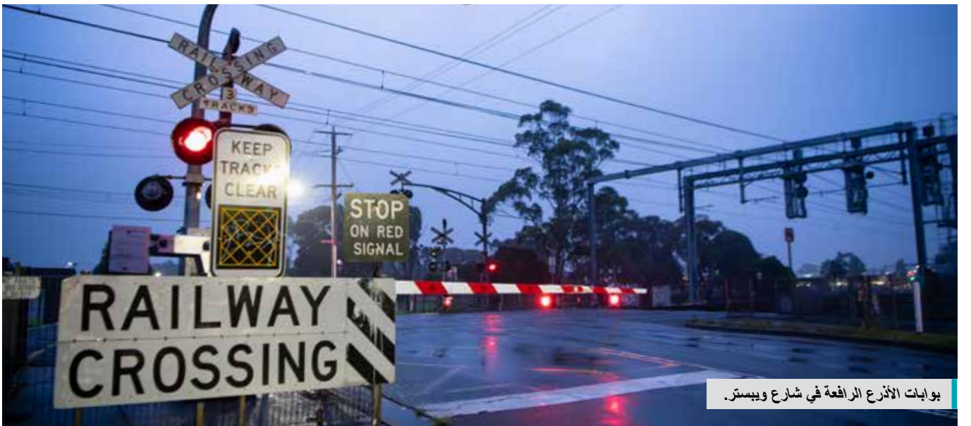
بوابات الأذرع الرافعة في شارع ويبستر.

امسح رمز الاستجابة السريعة ضوئيا أو قم بزيارة levelcrossings.vic.gov.au/webster-street لقراءة تقرير الاستشارة.