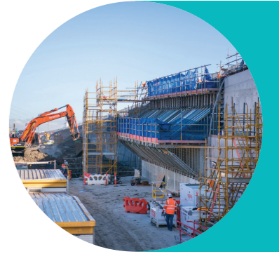
أعمال الحفر في مخرج النفق المتّجه إلى خارج المدينة

لمزيد من المعلومات عن المرفق، يُرجى زيارة الموقع الإلكتروني hiqualityecohub.com.au