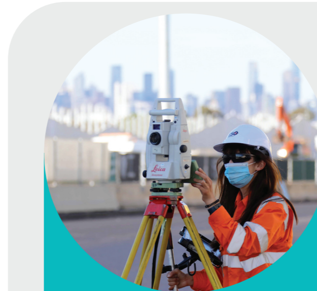
مسح الحارات المرورية الجديدة على West Gate Freeway