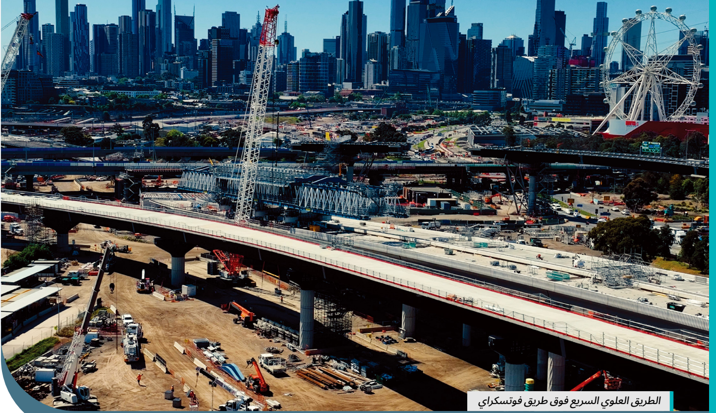
الطريق العلوي السريع فوق طريق فوتسكراي