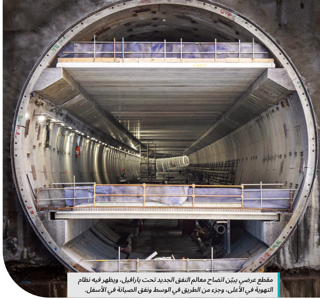
مقطع عرضي يبيّن اتساح معالم النفق الجديد تحت يارافيل، ويظهر فيه نظام التهوية في الأعلى، وجزء من الطريق في الوسط ونفق الصيانة في الأسفل.

وسيتم البدء في بناء الشبكة الخشبية للبوابة في العام الجديد.