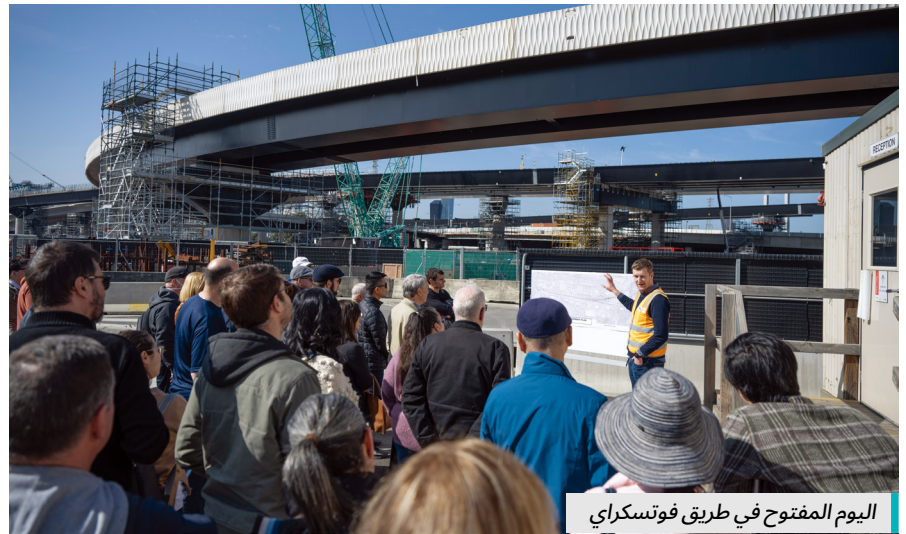
اليوم المفتوح في طريق فوتسكراي

حيث استقل الحاضرون حافلة عند مركز معلومات المشروع وتم اصطحابهم في جولة مصحوبة بمرشدين لمشاهدة جسور نهر ماري