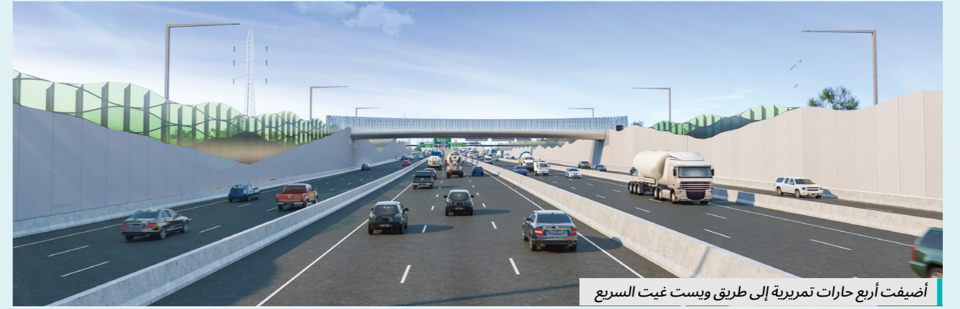
أضيفت أربع حارات تمريرية إلى طريق ويست غيت السريع