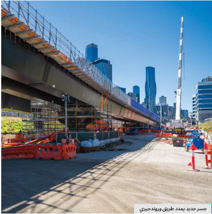
جسر جديد يمدد طريق ورونديجيري