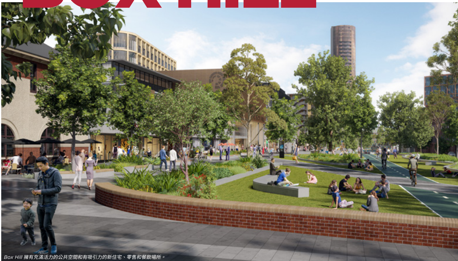
Box Hill 擁有充滿活力的公共空間和有吸引力的新住宅、零售和餐飲場所。