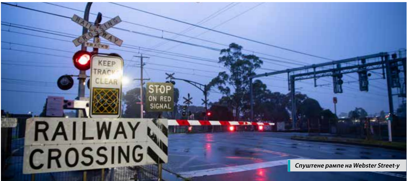
Спуштене рампе на Webster Street-у

Извештај о консултацијама можете да прочитате сканирајући QR-код или ако посетите levelcrossings.vic.gov.au/webster-street