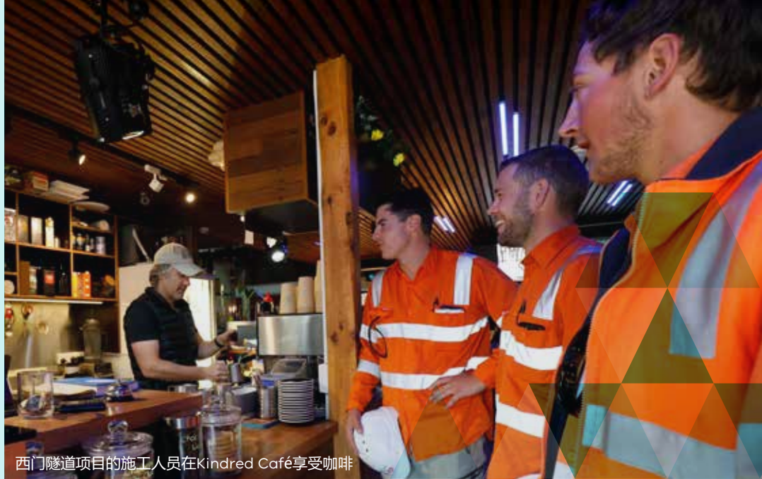
西门隧道项目的施工人员在Kindred Café享受咖啡

将迁移Footscray/Yarraville区Whitehall Street上的North Yarra Main Sewer，这将导致该区域12个月里车辆绕行。