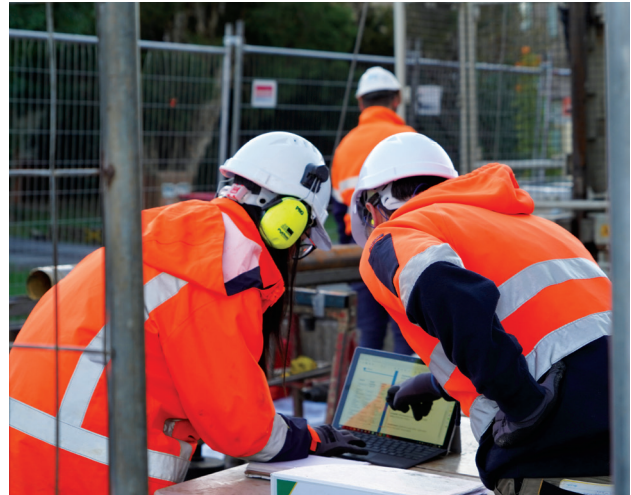
Ερευνες στον χώρο κατασκευής του SRL East στο Glen Waverley