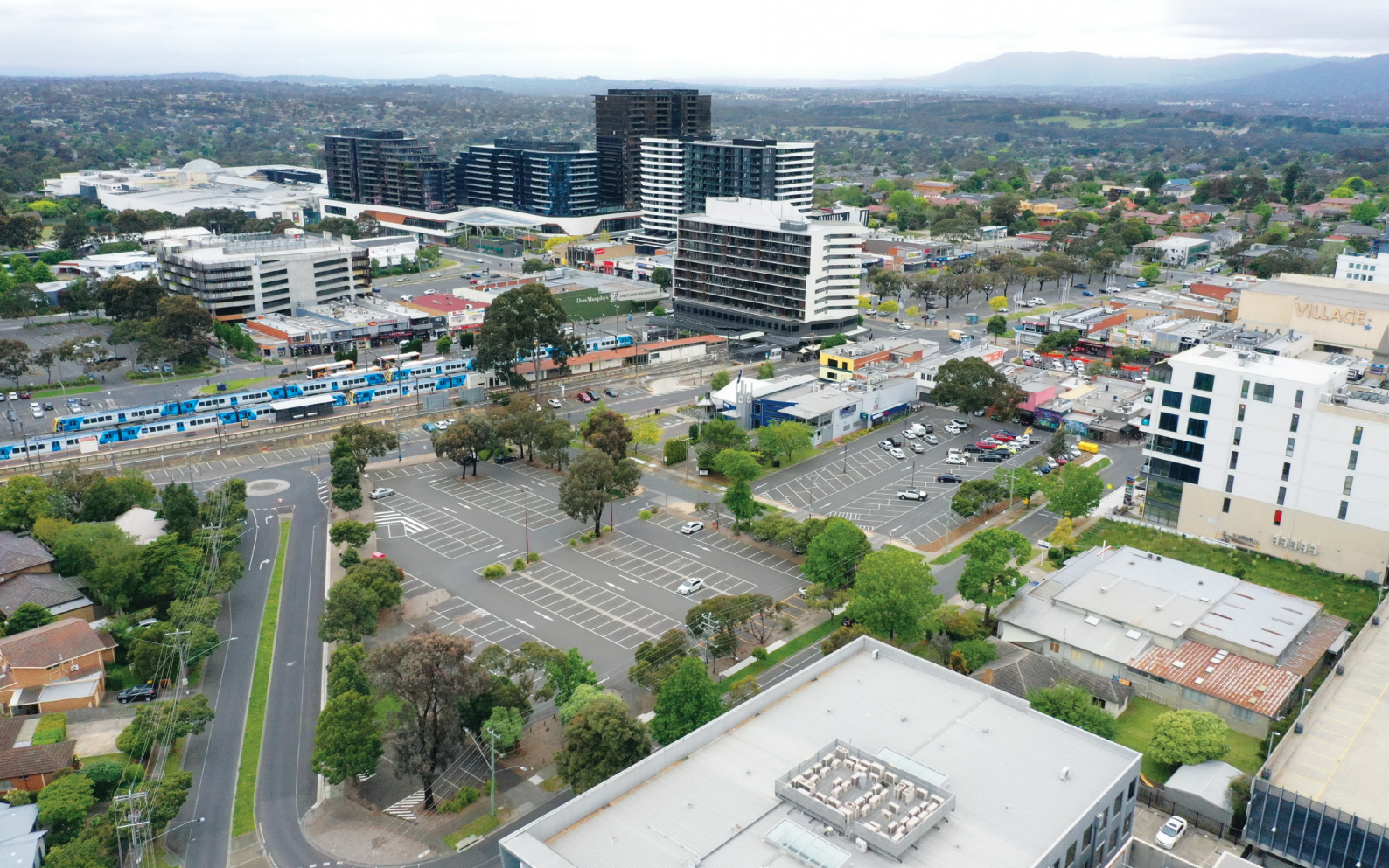
Αεροφωτογραφία του σταθμού SRL East στο Glen Waverley