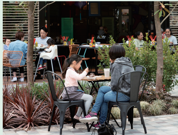
Το Εμπορικό Κέντρο Glen Shopping, Glen Waverley

Τα σχόλιά σας είναι σημαντικά για την οργάνωση και ανάπτυξη του Προαστιακού Σιδηροδρόμου (Suburban Rail Loop) και θα συμβάλλει στο να γίνουν οι χώροι κοντά στους σταθμούς του SRL East ακόμη καλύτεροι για κατοικία, εργασία και επίσκεψη.