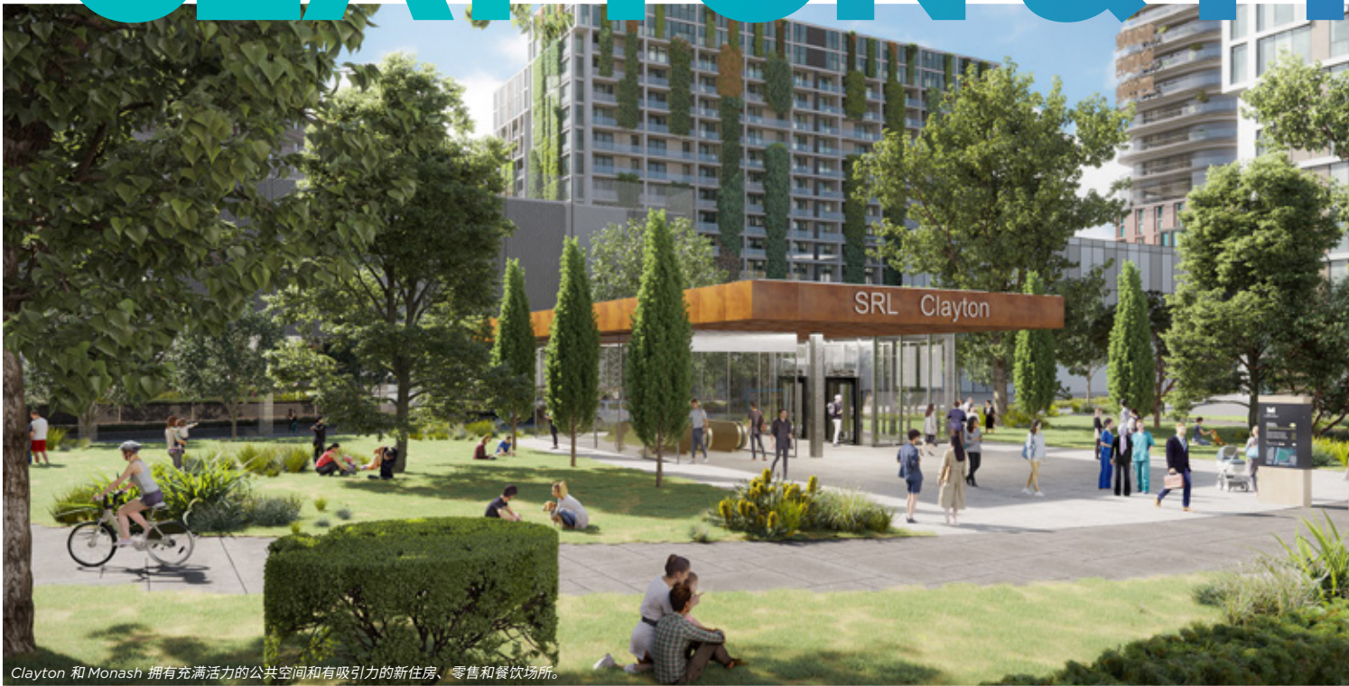
Clayton 和 Monash 拥有充满活力的公共空间和有吸引力的新住房、零售和餐饮场所。