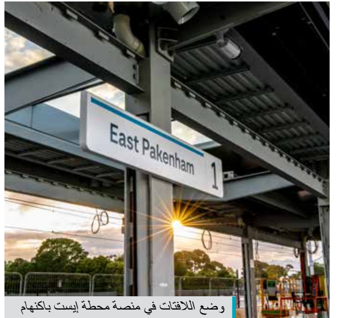
وضع اللافتات في منصة محطة إيست باكنهام