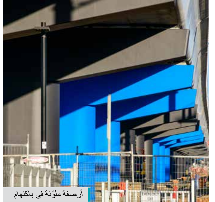
أرصعة ملونة في باكنهام