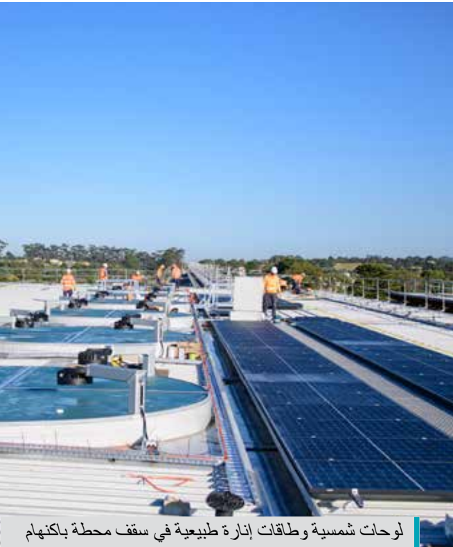
لوحات شمسية وطاقت إنارة طبيعية في سقف محطة باكنهام