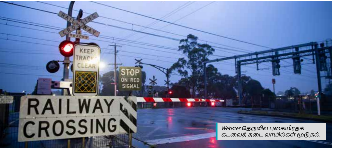
Webster தெருவில் புகையிரதக் கடவைத் தடை வாயில்கள் மூடுதல்.

ஆலோசனை அறிக்கையைப் படிக்க QR குறியீட்டை ஸ்கேன் செய்யவும் அல்லது levelcrossings.vic.gov.au/webster-street ஐப் பார்வையிடவும்.