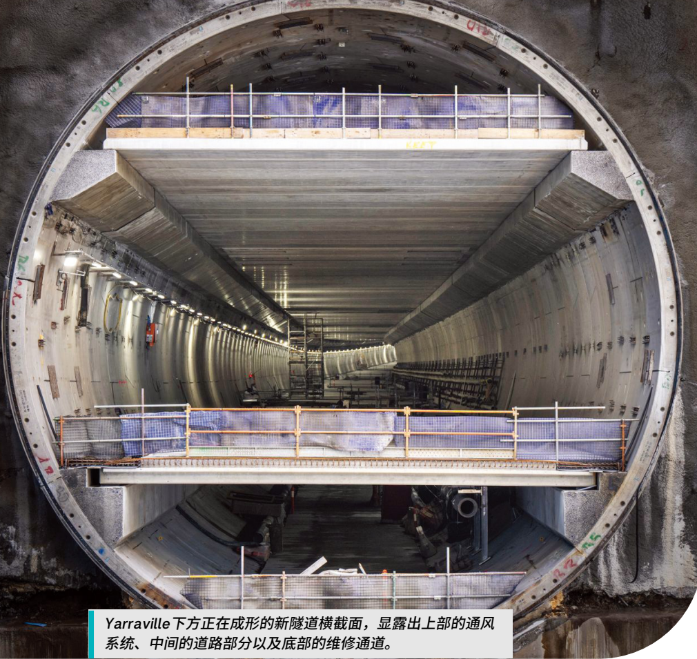
Yarraville下方正在成形的新隧道横截面，显露出上部的通风系统、中间的道路部分以及底部的维修通道。