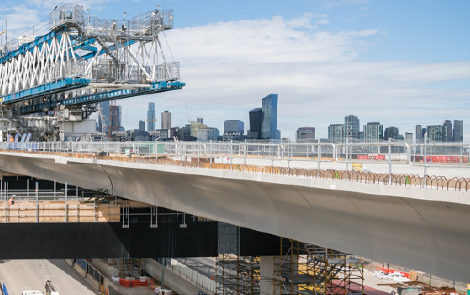
Thi công đường trên cao phía trên Đường Footscray