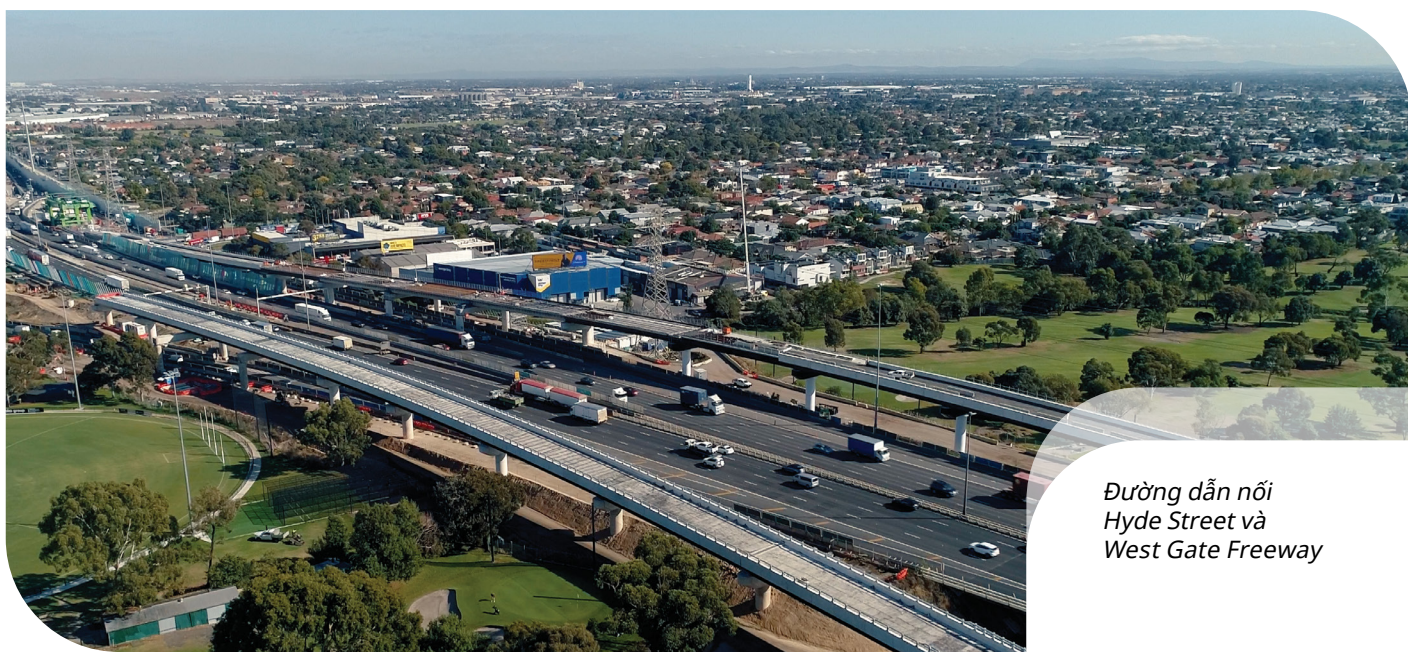
Đường dẫn nối Hyde Street và West Gate Freeway

Cảm ơn quý vị về sự kiên nhẫn trong quá trình thi công gần đây trên Hyde Street và Douglas Parade. Sau đó giao lộ mới an toàn hơn và có đèn tín hiệu giao thông được thông xe từ giữa tháng 7.