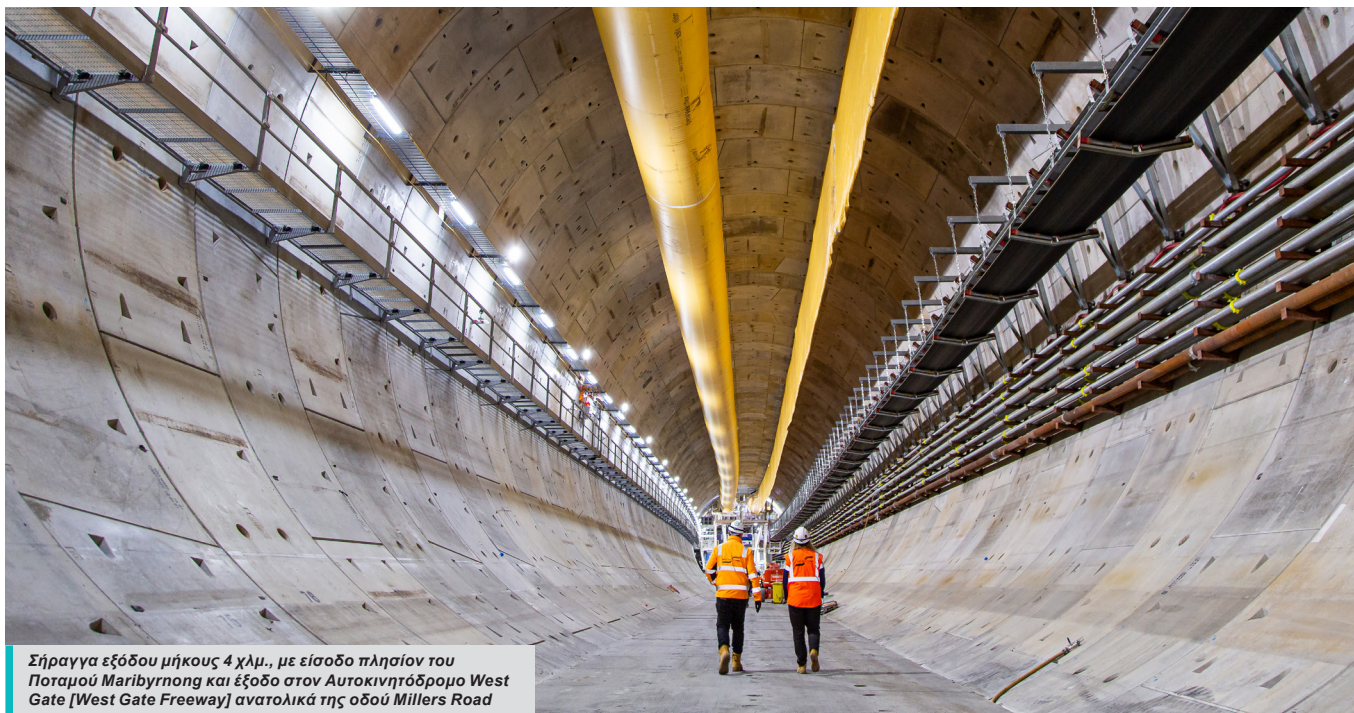
Σήραγγα εξόδου μήκους 4 χλμ., με είσοδο πλησίον του Ποταμού Maribyrnong και έξοδο στον Αυτοκινητόδρομο West Gate [West Gate Freeway] ανατολικά της οδού Millers Road