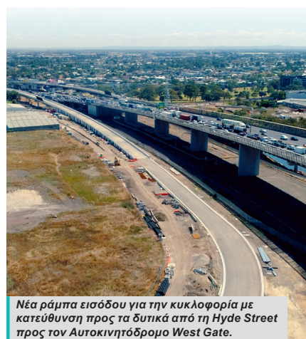
Νέα ράμπα εισόδου για την κυκλοφορία με κατεύθυνση προς τα δυτικά από τη Hyde Street προς τον Αυτοκινητόδρομο West Gate.

Η σήραγγα και οι νέες λωρίδες στον Αυτοκινητόδρομο West Gate, η Footscray Road και η Wurundjeri Way θα δοθούν στην κυκλοφορία στα τέλη του 2025.