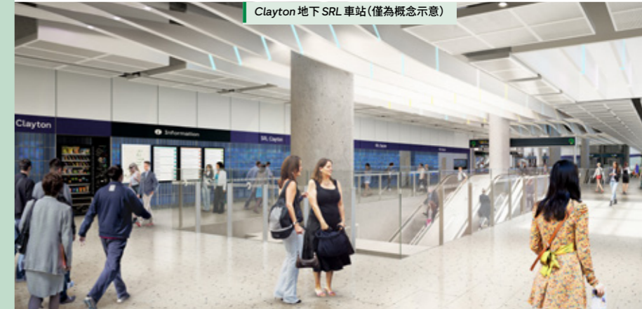
Clayton 地下 SRL 車站 (僅為概念示意)