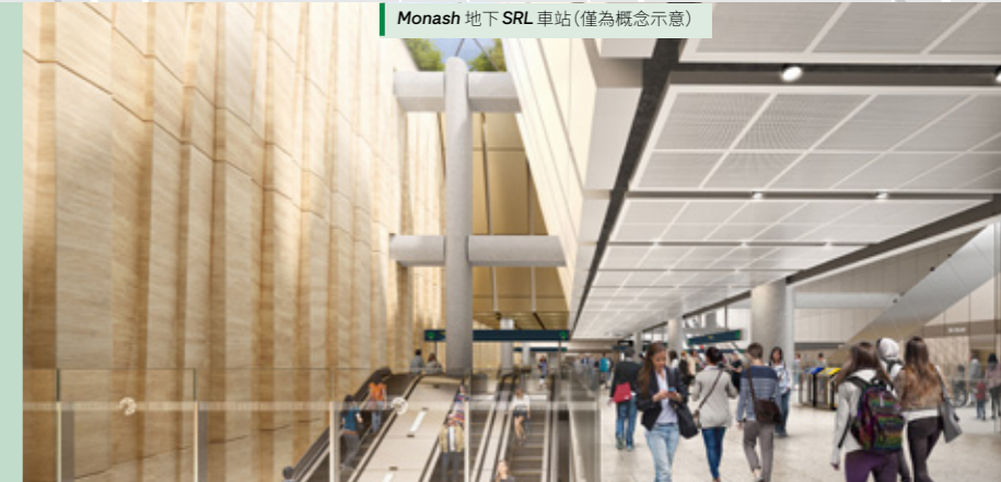
Monash 地下 SRL 車站 (僅為概念示意)

Clayton 和 Monash 車站內光線充足，設計亦引人入勝，其特色靈感來自於當地歷史和地標，包括該地區歷史悠久的採砂、當地醫學研究和先進的製造業。SRL 列車將於 2035 年開始載客。