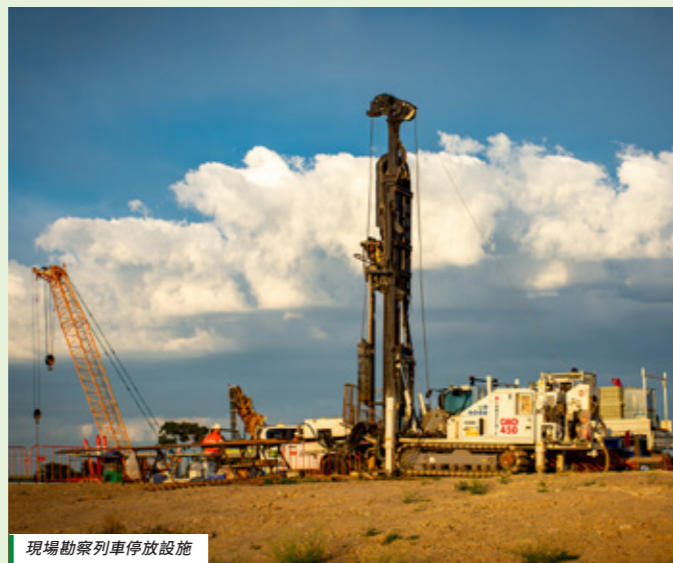
現場勘察列車停放設施

Linewide Alliance 於 2 月開展現場勘察，工程將從 2026 年年中逐步增加。