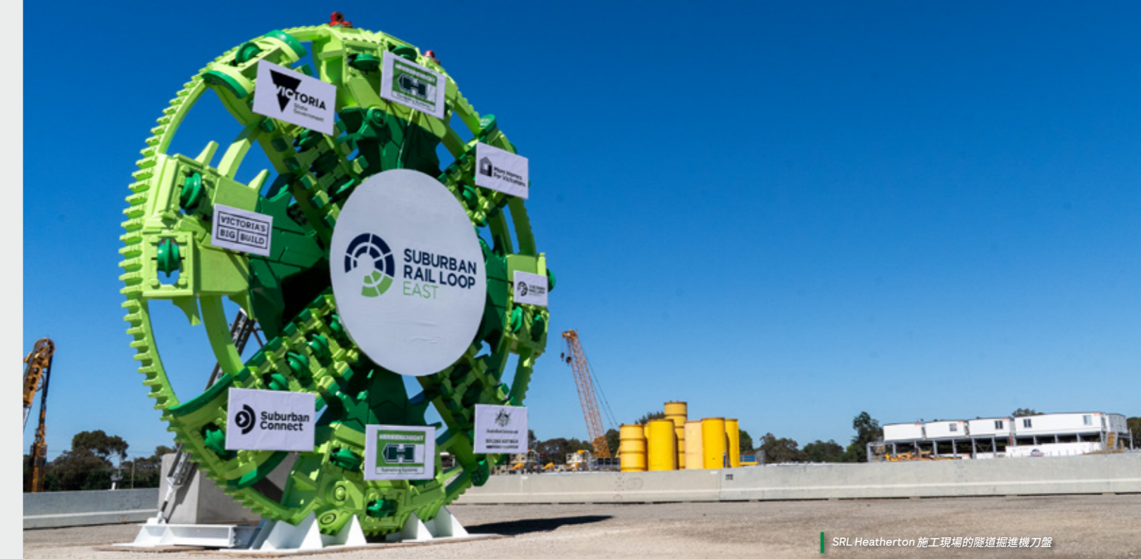
SRL Heatherton 施工現場的隧道掘進機刀盤