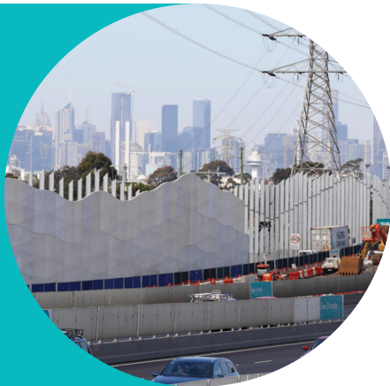
Lắp đặt tấm giảm tiếng ồn gần đường thoát ra Williamstown Road.

Năm 2020 là một năm không giống năm nào cả. Mặc dù có ít giao thông đi lại hơn trên các tuyến đường chính trong thời kỳ thực hiện lệnh hạn chế do Coronavirus, các đội công nhân đã vững bước đạt được một số cột mốc thi công lớn.