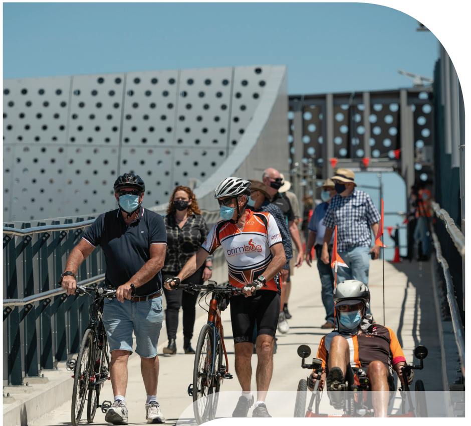
Các thành viên trong Nhóm Liên lạc Cộng đồng của Dự án Đường hầm West Gate sử dụng cầu vượt mới kết nối Brooklyn và Altona North.

Trong thời gian các cầu vượt đóng cửa, xe buýt đưa đón miễn phí được cung cấp cho cư dân địa phương sử dụng để đi qua đường cao tốc một cách an toàn.