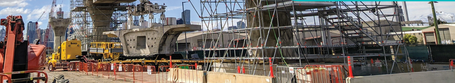
Máy làm đường trên cao nâng các đoạn đường lên trong thời gian thử nghiệm.