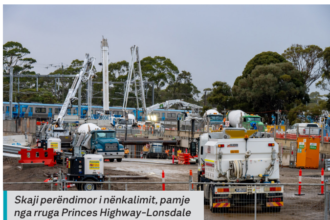
Skaji perëndimor i nënkalimit, pamje nga rruga Princes Highway-Lonsdale