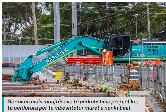
Gërmimi midis mbajtësve të përkohshme prej çeliku, të përdorura për të mbështetur muret e nënkalimit