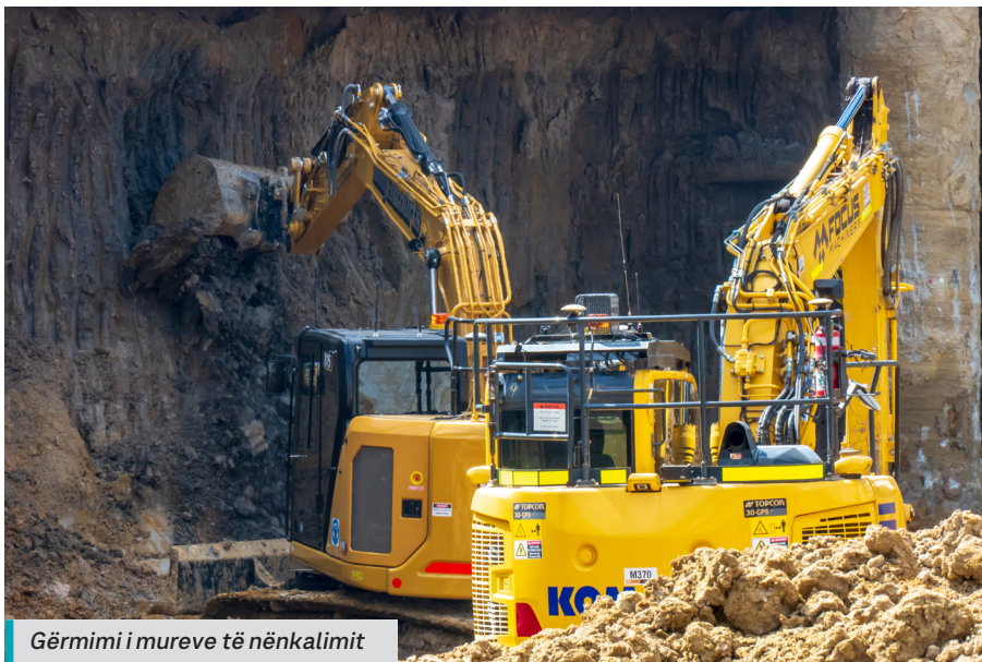
Gërmimi i mureve të nënkalimit