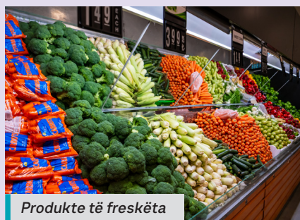
Produkte të freskëta