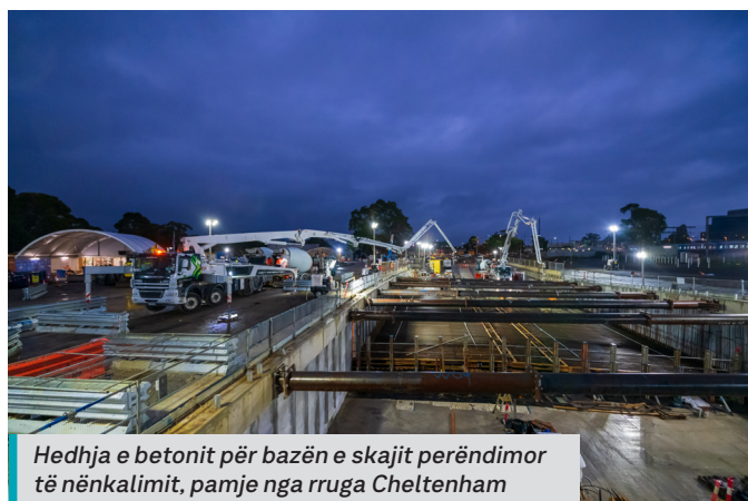
Hedhja e betonit për bazën e skajit perëndimor të nënkalimit, pamje nga rruga Cheltenham