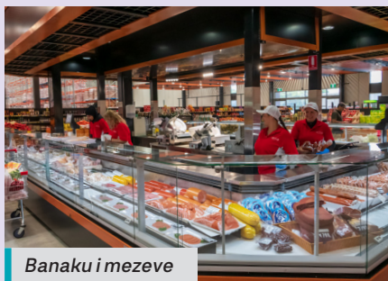
Banaku i mezeve