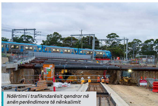
Ndërtimi i trafikndarësit qendror në anën perëndimore të nënkalimit