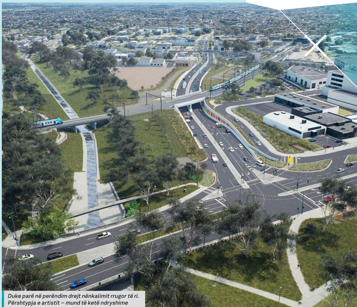
Duke parë në perëndim drejt nënkalimit rrugor të ri. Përshlyerja e artistit – mund të ketë ndryshime