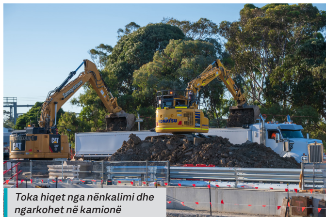
Toka hiqet nga nënkalimi dhe ngarkohet në kamionë