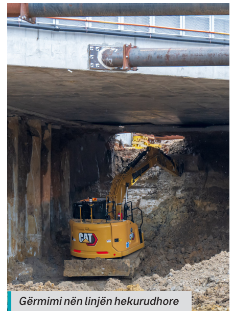
Gërmimi nën linjën hekurudhore