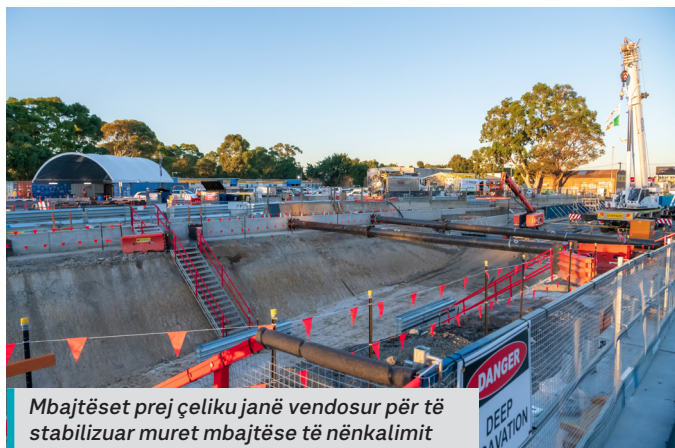
Mbajtëset prej çeliku janë vendosur për të stabilizuar muret mbajtëse të nënkalimit