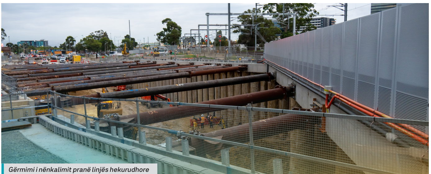
Gërmimi i nënkalimit pranë linjës hekurudhore