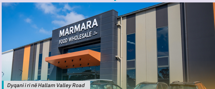
Dyqani i ri në Hallam Valley Road

f marmarahalalmeats @ marmara.halal.meats