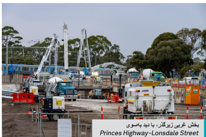
بخش غربی زیرگذر، با دید به سوی Princes Highway-Lonsdale Street