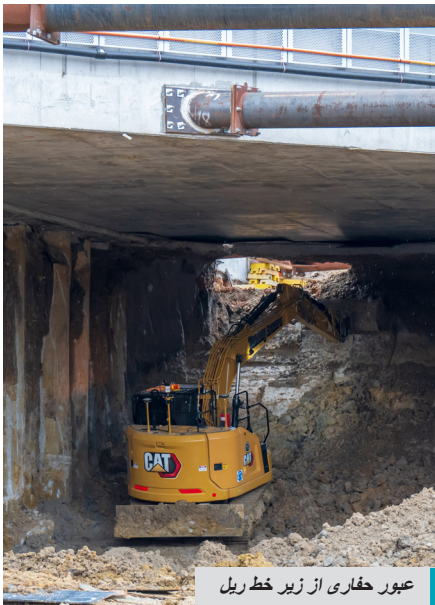
عبور حفاری از زیر خط ریل

زیرگذر جدید، به جاده‌های Cheltenham و Hammond در بخش غربی خط ریل، و همچنان به یک چهارراه جدید دارای چراغ ترافیکی در Princes Highway-Lonsdale Street در بخش شرقی وصل خواهد شد.