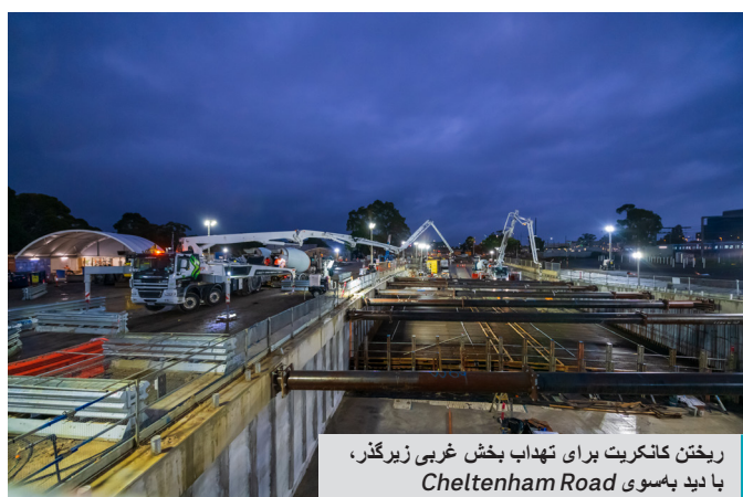
ریختن کانکریت برای تهداب بخش غربی زیرگذر، با دید به سوی Cheltenham Road