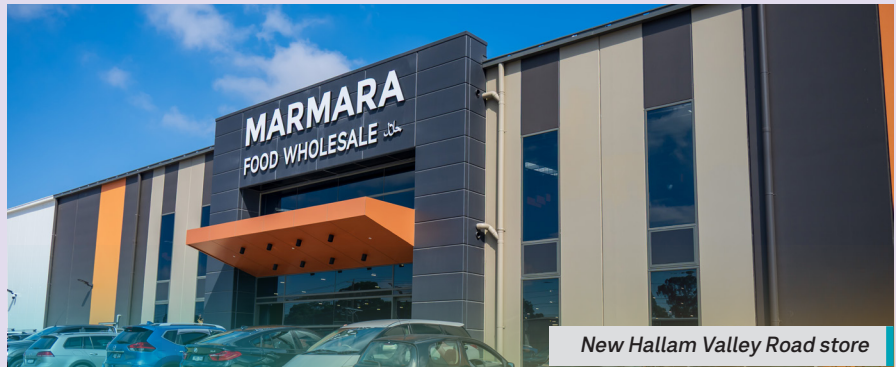
New Hallam Valley Road store