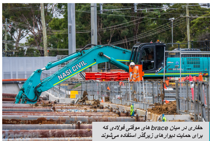
حفاری در میان brace های موقتی فولادی که برای حمایت دیوارهای زیرگذر استفاده می شوند