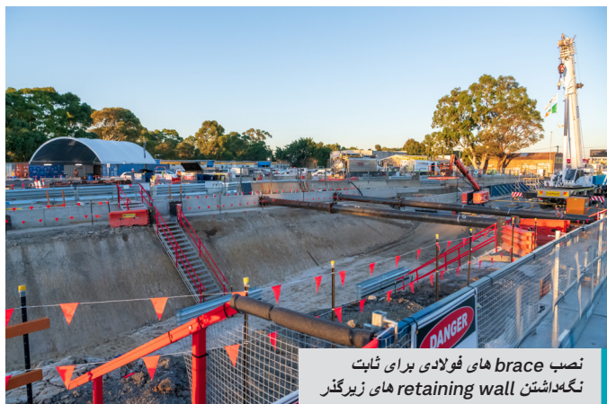
نصب brace های فولادی برای ثابت نگه داشتن retaining wall های زیرگذر