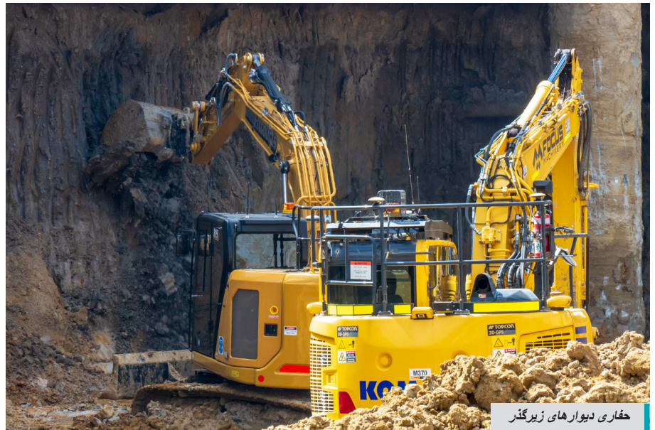
حفاری دیوارهای زیرگذر