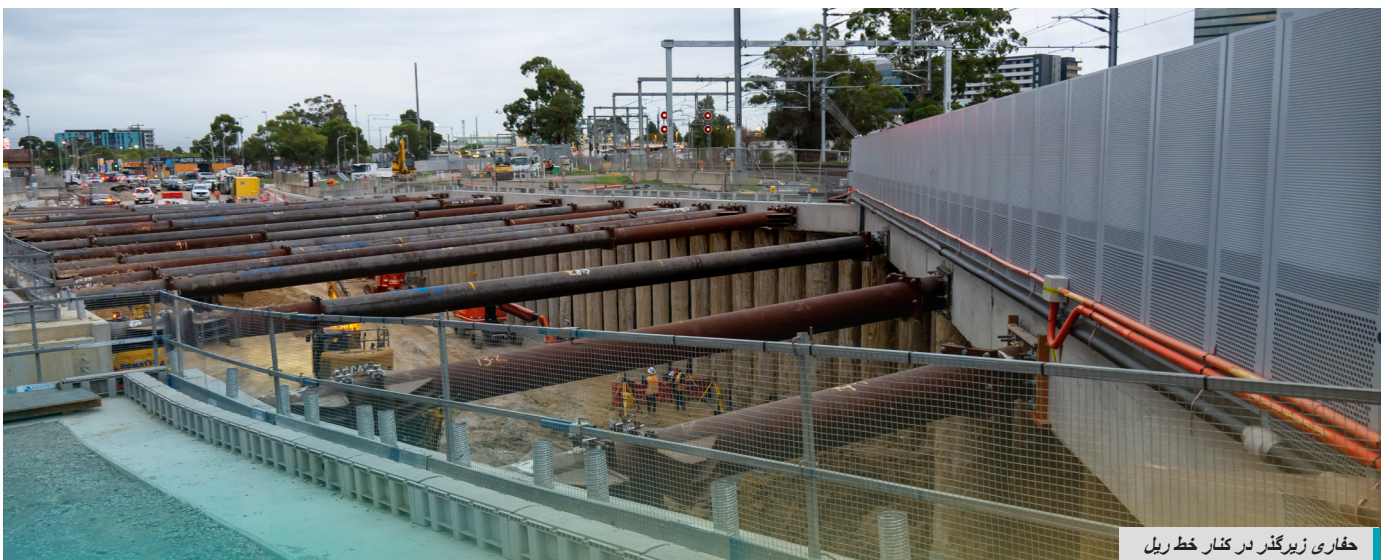
حفاری زیرگذر در کنار خط ریل