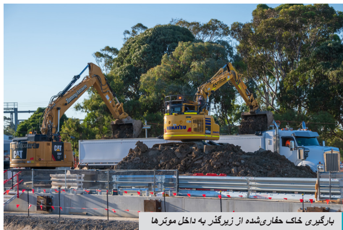
بارگیری خاک حفاری شده از زیرگذر به داخل موترها