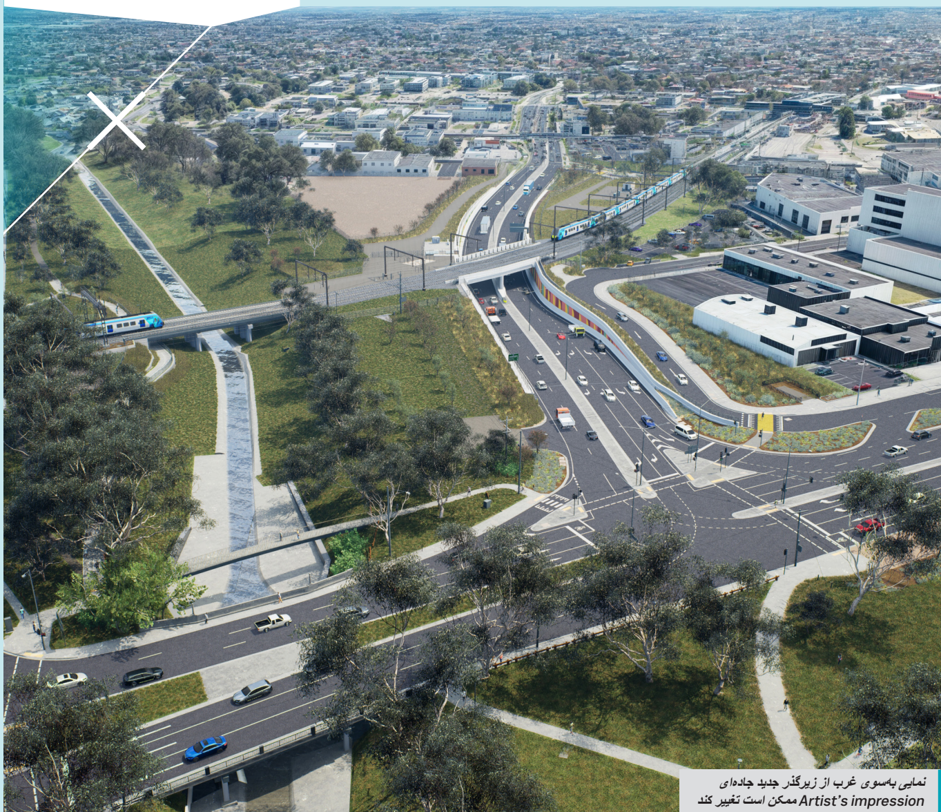
نمایی به سوی غرب از زیرگذر جدید جاده‌ای Artist's impression ممکن است تغییر کند

زیرگذر جدید یک اتصال مستقیم شرق-غرب برای وسایط نقلیه با هر اندازه ایجاد می‌کند و به انتقال موترهای باربری و وسایط سنگین از جاده‌های محلی و خروج آن‌ها از CBD شهر Dandenong کمک می‌نماید. در چهارراه جدید واقع در Princes Highway-Lonsdale Street، رانندگان قادر خواهند بود بدون محدودیت‌های چرخش در ساعات اوج ترافیک به چپ یا راست بپیچند.