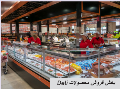
بخش فروش محصولات Deli