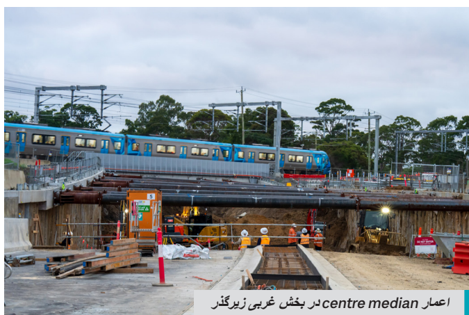
اعمار centre median در بخش غربی زیرگذر