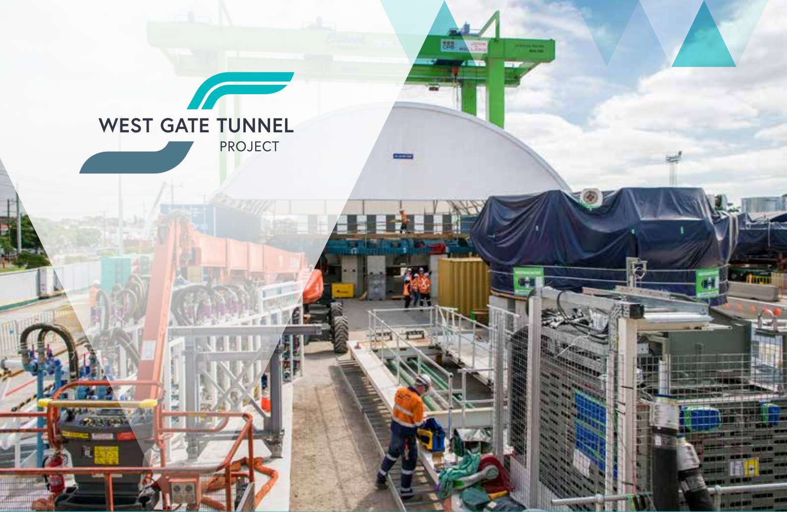
隧道掘进机Bella在隧道北入口组装